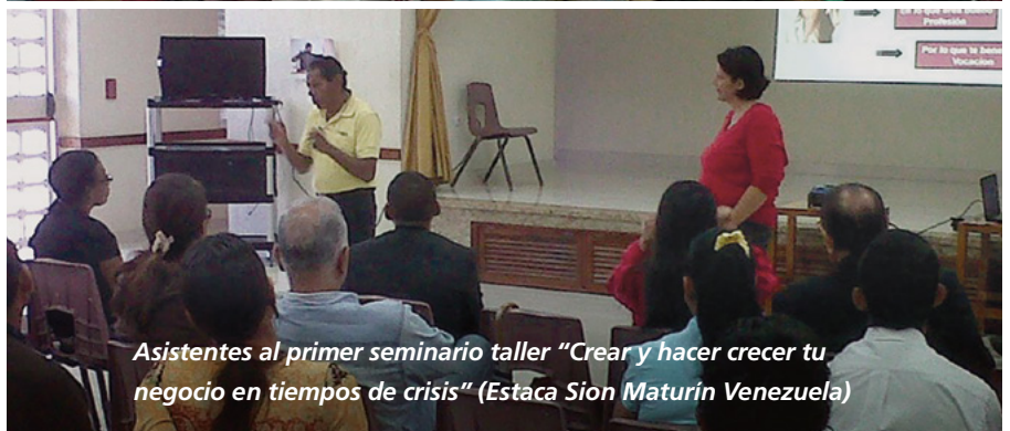
Asistentes al primer seminario taller “Crear y hacer crecer tu negocio en tiempos de crisis” (Estaca Sión Maturín Venezuela)