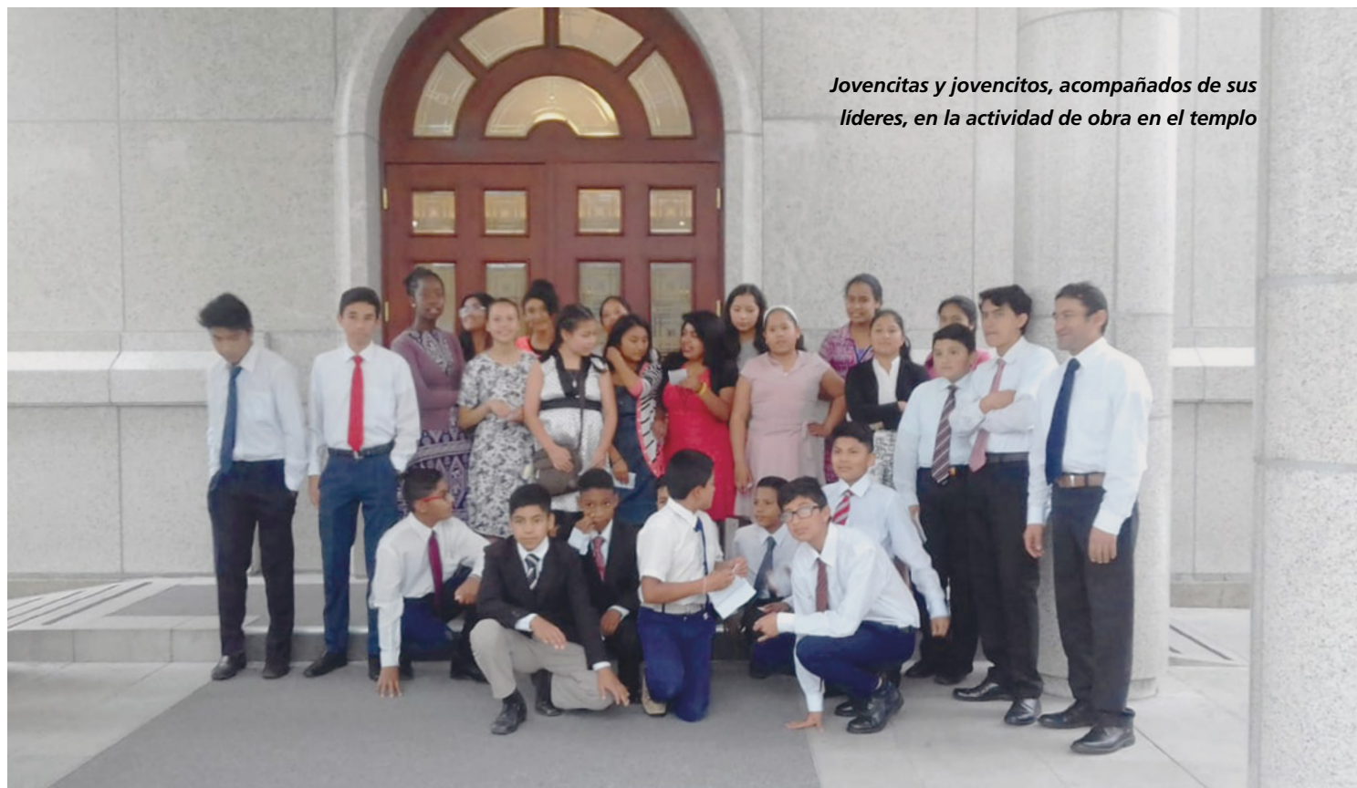
Jovencitas y jovencitos, acompañados de sus líderes, en la actividad de obra en el templo

Las fotos, favor de enviarlas en archivo "jpg" de buena resolución y tamaño. ■