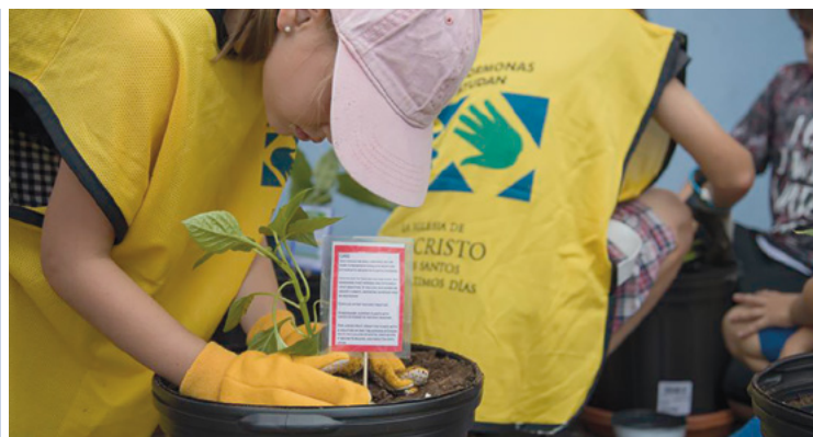
Día Internacional de Servicio

desde el día en el que el élder M. Russell Ballard, actualmente Presidente en Funciones del Cuórum de