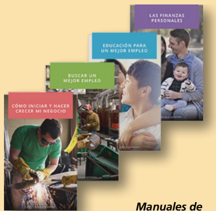
Manuales de Cursos disponibles de Servicio de Autosuficiencia

son principios guías que se necesitan para construir nuestro carácter, para permitirnos enfrentar los desafíos que nos esperan en nuestro camino hacia la autosuficiencia.