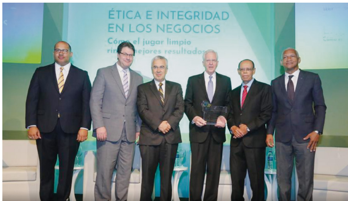
Conferencia Internacional de Ética

Auspiciaron el evento la PUCMM, el Colegio Dominicano de Periodistas,