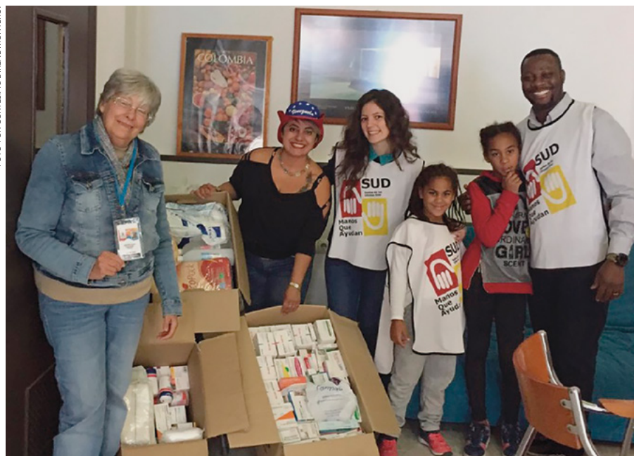
Responsables de la asociación LEAN en Alicante junto a algunos miembros de la Estaca Elche.

Durante el pasado mes de octubre, los miembros de la Estaca de Elche llevaron a cabo una campaña de donación de medicamentos para Venezuela, bajo el programa “Manos Mormonas que Ayudan”. Las distintas unidades de la estaca recolectaron 387 artículos, entre los que destacan pañales, medicinas y otros útiles médicos. La entrega a los responsables de la Asociación Lean se realizó el 10 de noviembre en Alicante.