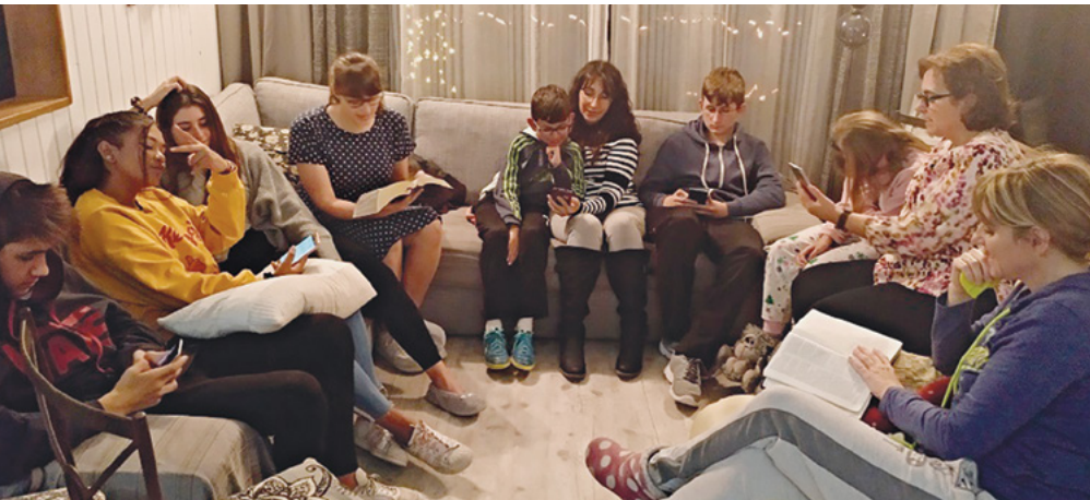
El grupo de jóvenes de Seminario del barrio de Tarragona.

Editora de las páginas locales de la revista Liahona