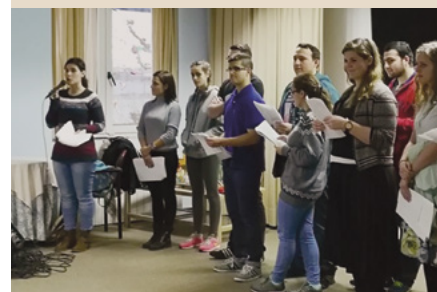
Miembros de todas las edades fueron a cantar villancicos a la residencia de ancianos "San Agustín".

Misioneros y miembros, mayores y pequeños, acudieron a varios centros comerciales de A Coruña para recolectar alimentos para el Banco de Alimentos de la ciudad. De este modo participaron en la pasada edición del Día Nacional de Servicio.