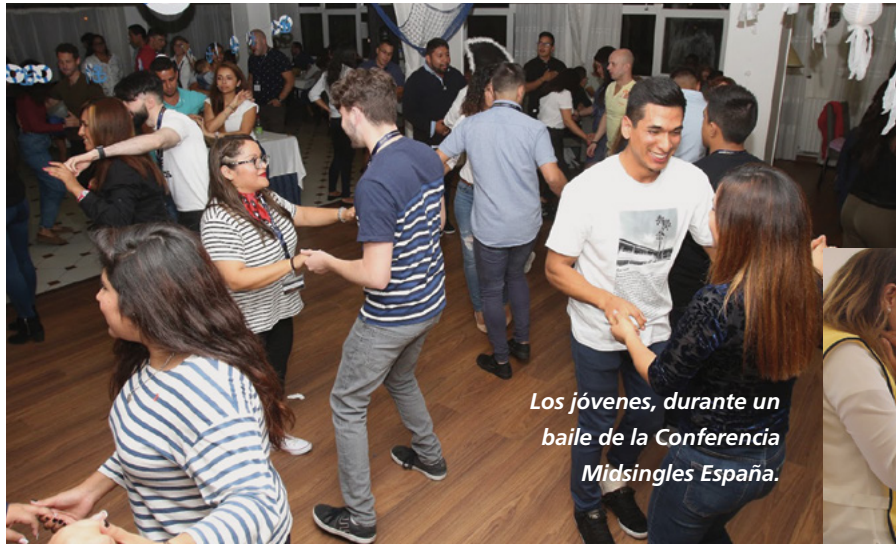
Los jóvenes, durante un baile de la Conferencia Midsingles España.

Durante la visita a la Fundación Padre Rubinos, un centro para personas mayores a las que los jóvenes deleitaron con un espectáculo de talentos. ▼