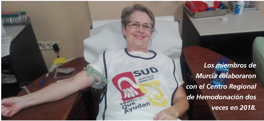
Los miembros de Murcia colaboraron con el Centro Regional de Hemodonación dos veces en 2018.