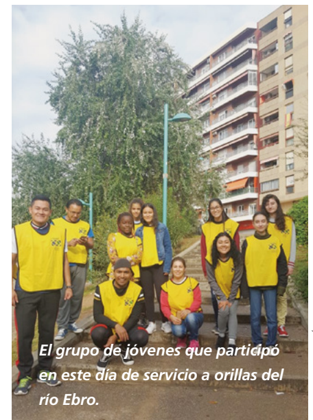
El grupo de jóvenes que participó en este día de servicio a orillas del río Ebro.

Los jóvenes y sus líderes pudieron de esta manera aportar su pequeño grano de arena ayudando a que las zonas verdes estén limpias, impidiendo que los residuos de plástico y vidrio vayan a parar al río, contaminándolo