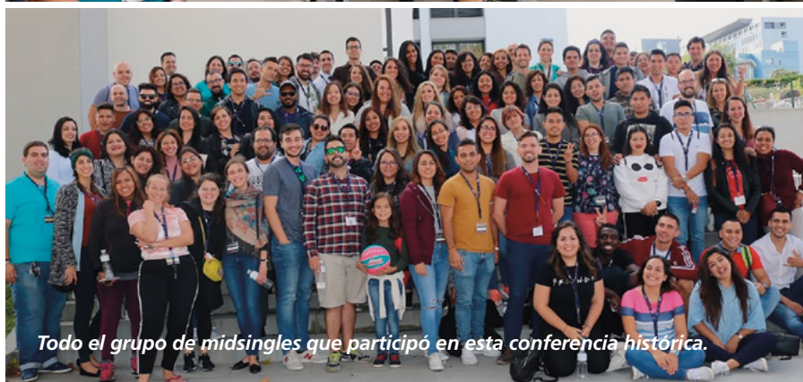
Todo el grupo de midsingles que participó en esta conferencia histórica.

durante las actividades dentro y fuera del hotel. Hubo dos momentos llenos de luz en particular: uno en la visita por la noche a la torre de Hércules, el faro más antiguo del mundo que sigue en funcionamiento, donde pudimos ver la luz que guía constantemente a los marineros y, delante del mar, cantamos juntos "Brillan rayos de clemencia". El otro fue durante la visita a la Fundación Padre Rubinos para presentar un espectáculo de talentos dirigido a los ancianos residentes; el amor se sintió desde la llegada de los midsingles, que se encargaron de acompañar a cada abuelito y de animarlos.