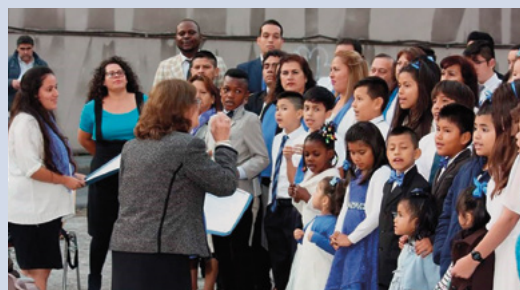
El coro de niños y padres cantó "Oración de un niño".