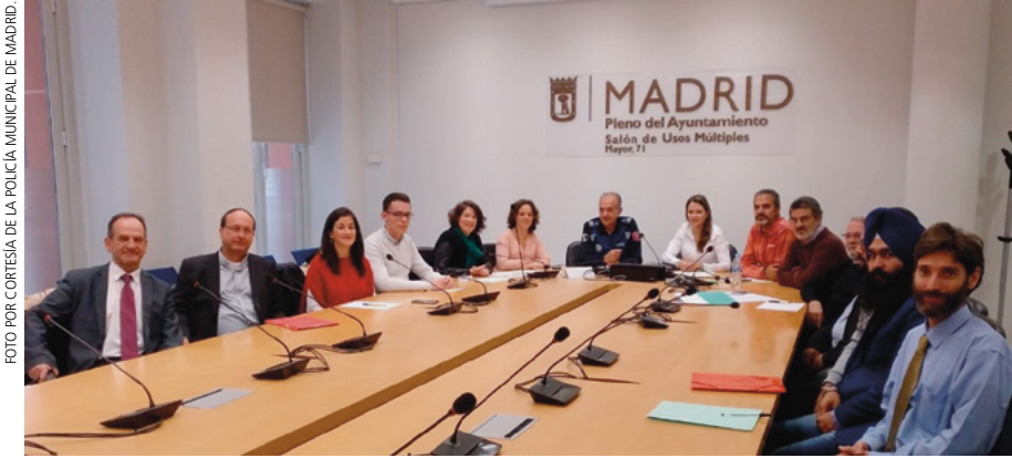
Mesa técnica de confesiones religiosas de la Unidad de Gestión de la Diversidad.

de interlocutor entre el Archimandrita Ortodoxo de España y Portugal y yo con dos mujeres policías municipales. En este primer contacto, nos informaron sobre la creación de la Mesa Técnica de las religiones de la UGD de la policía municipal de Madrid, y nos explicaron el plan de trabajo de este cuerpo especializado de la policía en la defensa de las personas que pertenecen a grupos que sufren