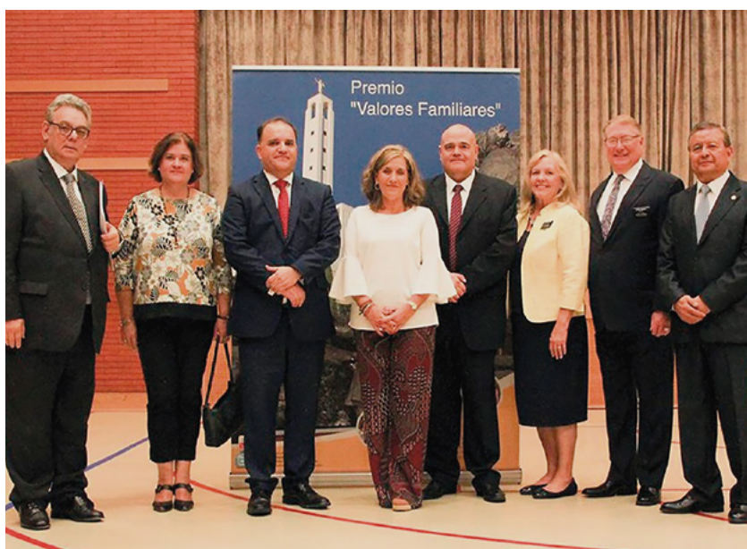
The Family Watch fue en 2018 la ganadora del Premio Valores Familiares en su quinta edición.