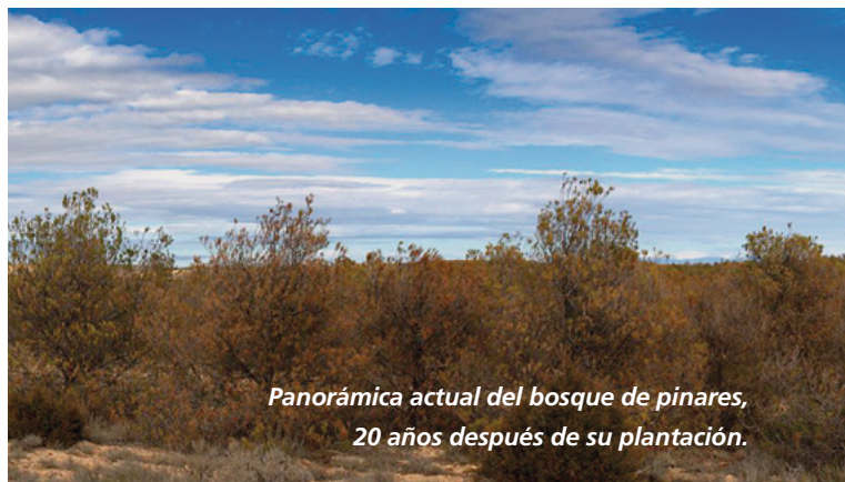
Panorámica actual del bosque de pinos, 20 años después de su plantación.