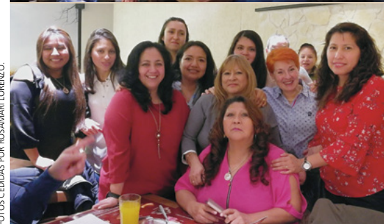
El grupo de matrimonios que se juntaron para compartir esta cena especial.