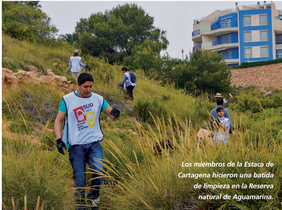
Los miembros de la Estaca de Cartagena hicieron una batida de limpieza en la Reserva natural de Aguamarina.