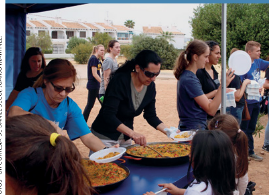
El Ayuntamiento se encargó de proporcionar la comida a los voluntarios.