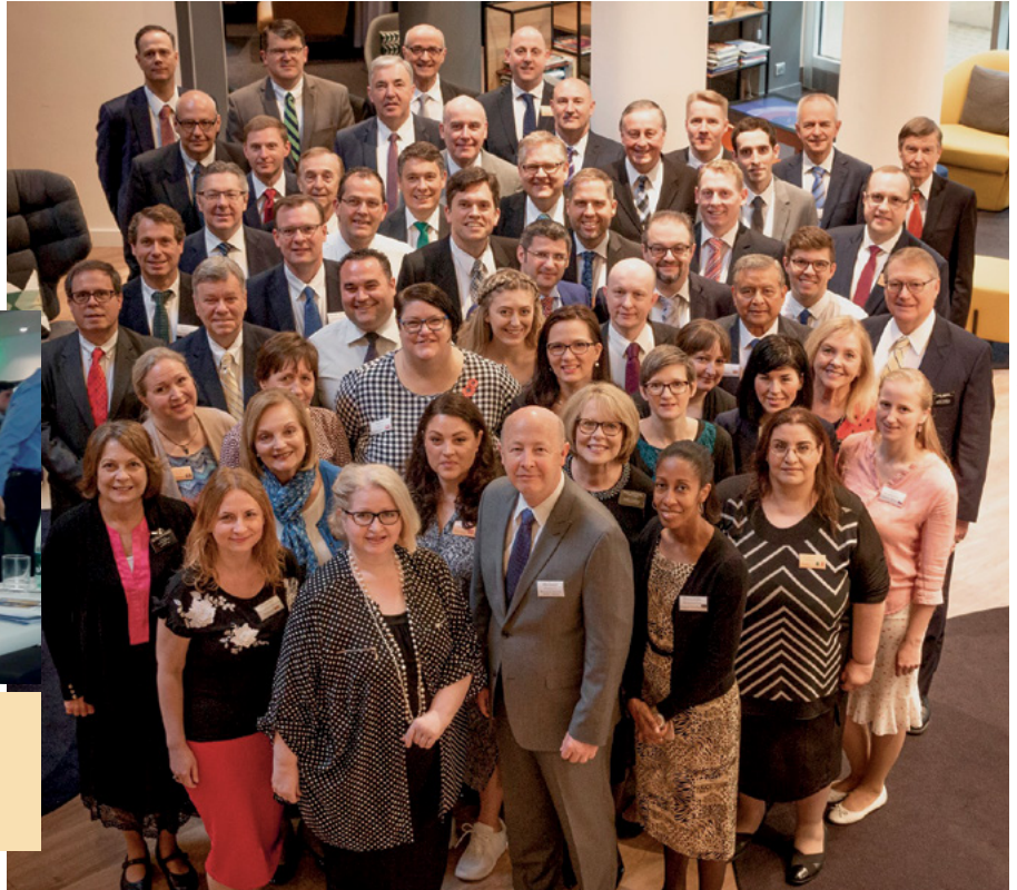
Todo el grupo de líderes de Asuntos Públicos del Área Europa que asistieron al seminario de capacitación en Versailles.