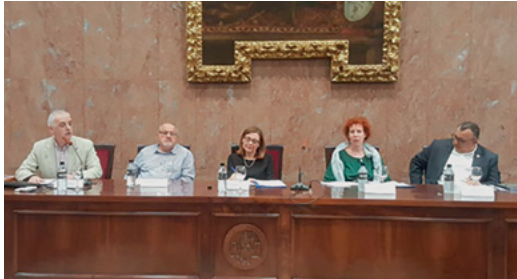
Varios de los ponentes durante las jornadas sobre libertad de creencias.