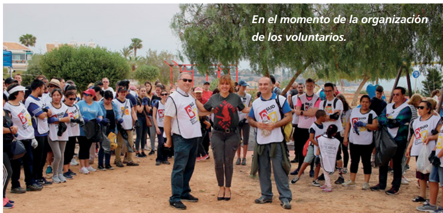
En el momento de la organización de los voluntarios.