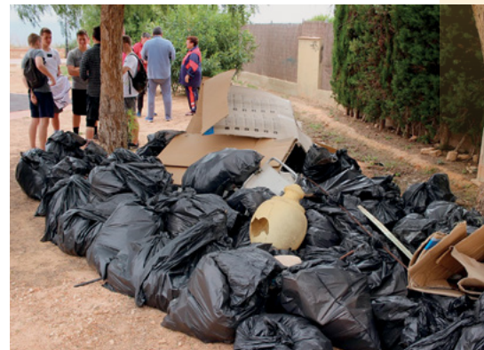
Todas las bolsas de desechos que se recogieron a lo largo de la mañana.