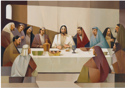
"La Última Cena"