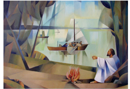
"Echad la red... y hallaréis"