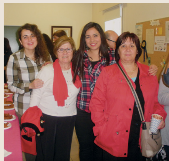
Las hermanas se ayudaron y enseñaron las unas a las otras acerca de los principios de preparación y autosuficiencia.