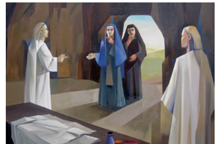
"El sepulcro vacío"