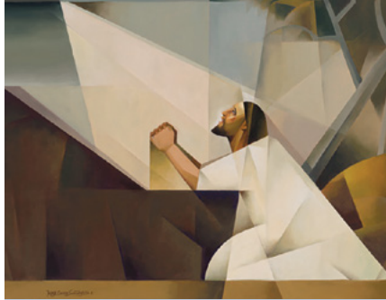
"Getsemaní (Jesús es mi Luz)"