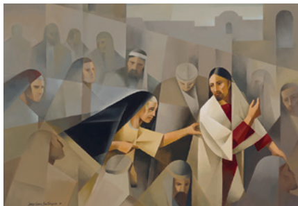
"El borde de Su manto"