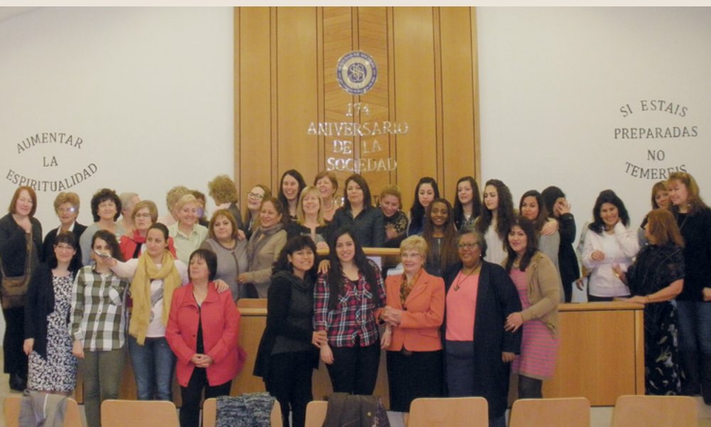
Las hermanas de los barrios Sabadell I y Sabadell II.

Fue una actividad en la que se recordó que “si estáis preparados no temeréis”, porque cuando llega la necesidad, el tiempo de preparación ya ha pasado. ■