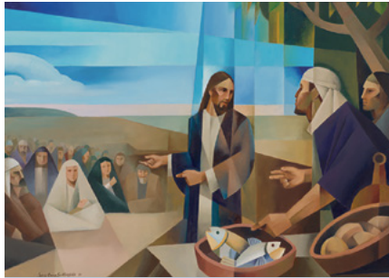
"Dadles de comer"