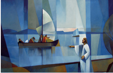
"El llamado", obra ganadora en la última edición del Concurso Internacional de Arte de la Iglesia.