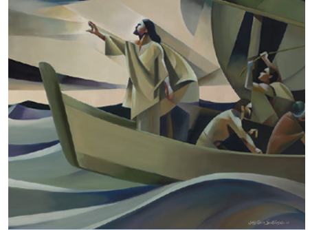
"Paz, cálmense (La tempestad)"