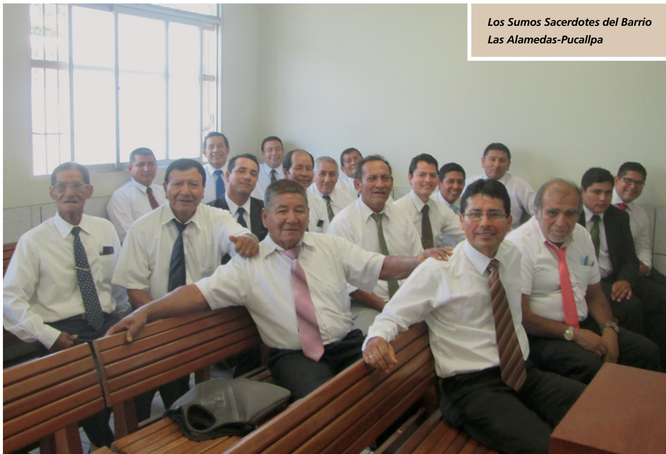
Los Sumos Sacerdotes del Barrio Las Alamedas-Pucallpa

el tema se hizo firme la decisión de comprometerse a guardar este mandamiento en cada uno de los miembros del grupo. Sé que la Noche de Hogar es la guía que nos permite tener una familia unida y fortalecida para afrontar los desafíos de la vida. Sé que Jesucristo vive y estamos en la verdad. ■