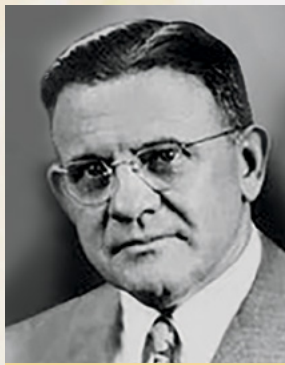
Élder Henry D. Moyle