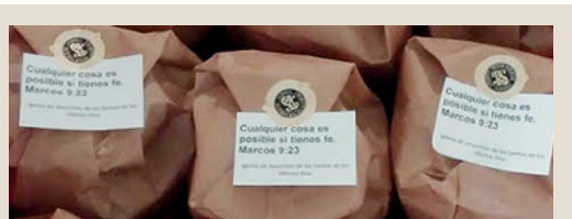
Paquetes de almuerzo