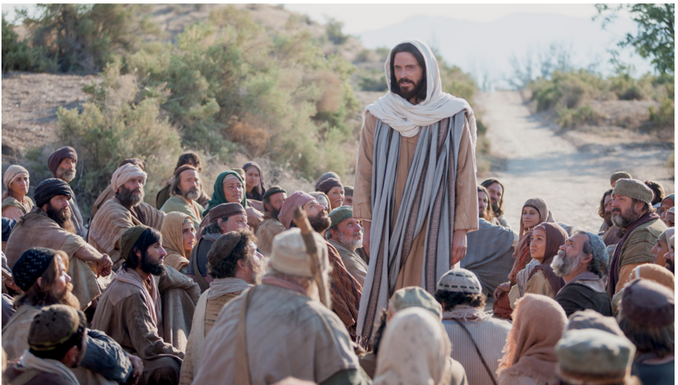
Puerto Rico www.prensamormona.org.pr