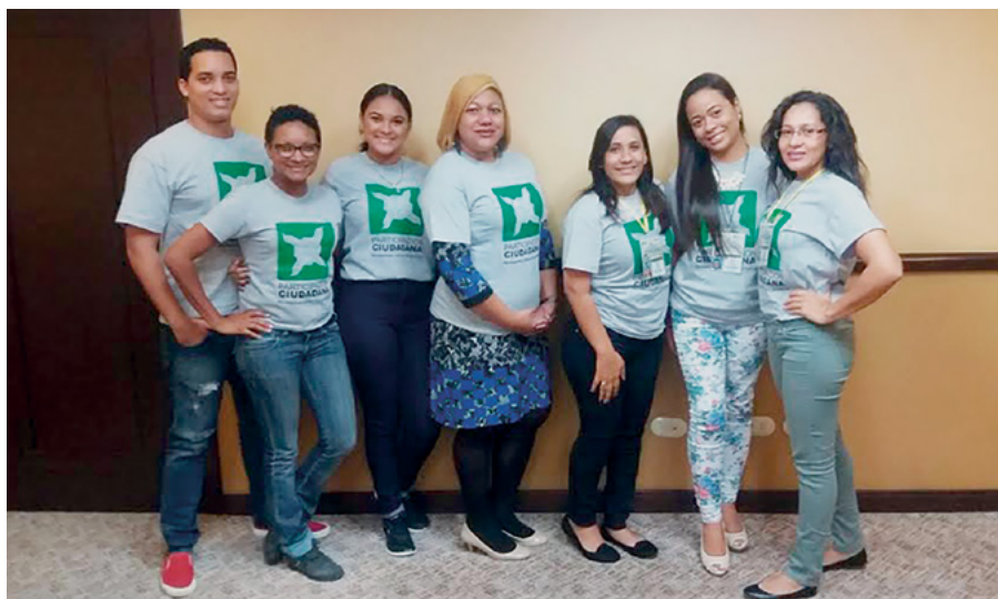
Algunos participantes voluntarios

monitoreando los medios de comunicación a nivel nacional, a saber: prensa, radio, TV y redes sociales, a fin de identificar los incidentes que