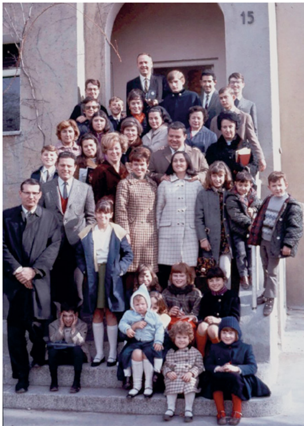
Día 4 de febrero de 1968, primera reunión dominical de la Rama Madrid, en España.

Para entonces, la Iglesia ya se había mudado al semisótano de Guzmán el Bueno. Cuando visité por primera vez la Iglesia, en octubre de 1970, había por tanto una sola rama que se reunía en Guzmán el Bueno. Asistí a las reuniones durante varios meses, hasta que me bautizaron el 30 de enero de 1971 en la Rama Madrid 2, seis días después de la división. Billie Forrest Fotheringham, entonces Director General de Kodak