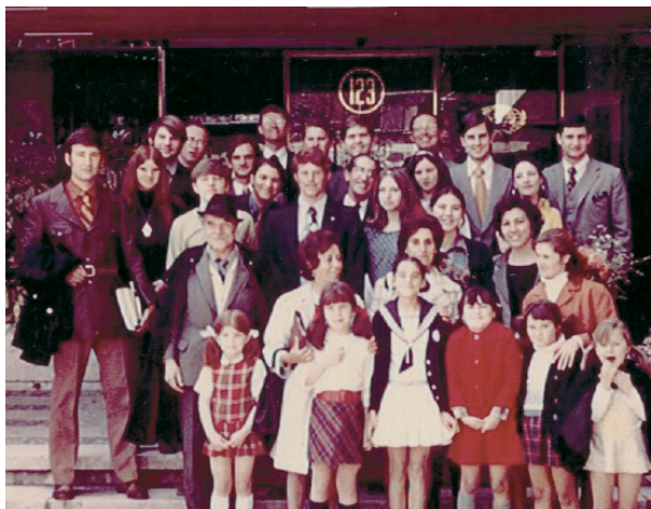
Grupo de miembros de la Iglesia delante del edificio de la calle Guzmán el Bueno de Madrid.

las demás organizaciones auxiliares se reunían entre semana. Recuerdo las mutuales de los martes, con todos los miembros allí metidos, con clases separadas de jóvenes y adultos, y juegos para terminar. Después, la Iglesia simplificó las reuniones hasta dejarlas como están ahora; y aunque me parece muy bien la simplificación, lo cierto es que estar tanto tiempo en la Iglesia nos hacía mucho bien a todos, que llegamos a formar una gran familia. ■