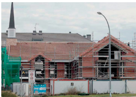
Las obras del nuevo centro de reuniones de Logroño. Imagen tomada a finales de 2015.