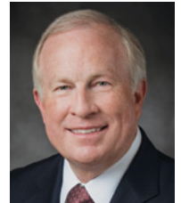
Élder Timothy J. Dyches

Las bendiciones del trabajo en la familia incluían la emoción del esfuerzo creativo y el de “un trabajo bien hecho”, además de permitirnos adquirir habilidades para el presente y el futuro, rendir servicio a nuestros semejantes, comprender las