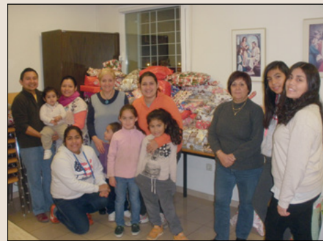
Los niños de Sabadell recogieron juguetes que en diciembre entregaron a varias organizaciones que se dedican a velar por niños necesitados y sus familias.