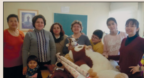
Recogida de juguetes en Zaragoza.