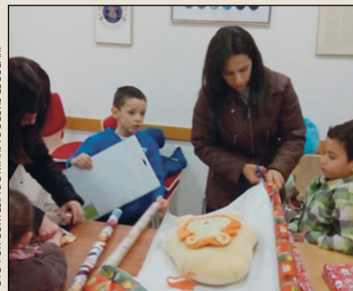
Recogida de juguetes en Lleida.