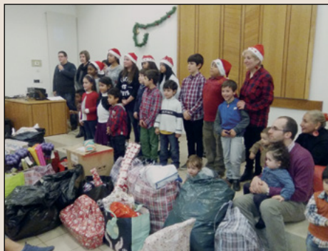
En total se entregaron 249 juguetes bien envueltos, además de varias bolsas de ropa.

niñas entregaron los juguetes con alegría y entusiasmo, cantando un villancico tradicional, “Les dotze van tocant”. Realmente somos más felices cuando compartimos lo que tenemos con los que tienen menos; esa es la verdadera felicidad. Después nos visitó Papá Noel repartiendo un obsequio a cada niño de la Primaria. ■