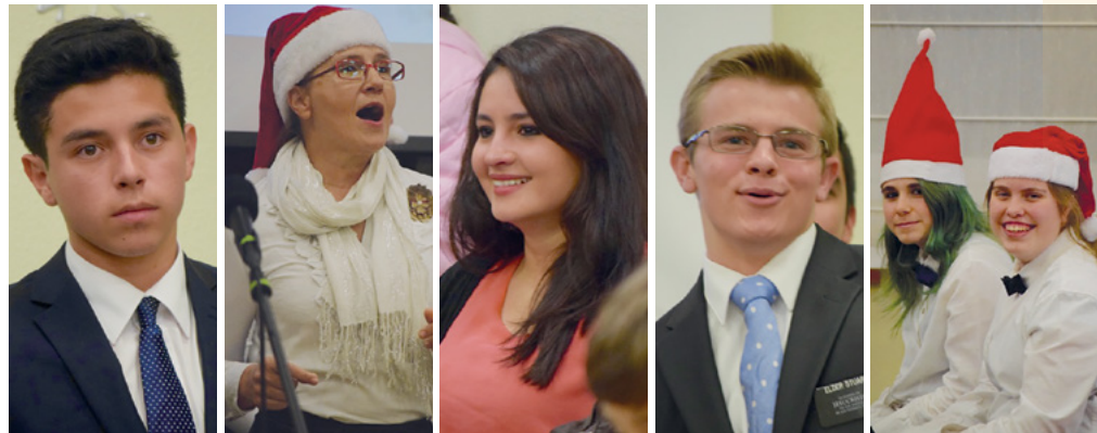
Diversas instantáneas del evento.

El coro tiene previsto realizar otras actuaciones en el nuevo centro que la DFA (Asociación de Disminuidos Físicos de Aragón) tiene en la capital zaragozana, pudiendo llevar así el mensaje del Evangelio a muchas personas más. ■