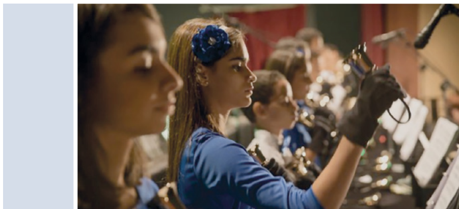
El espíritu que se sintió a medida que la presentación transcurría fue indescriptible.

El élder y la hermana McGuire: “Ambos [mi esposa y yo] nos deleitamos con el concierto que vimos anoche; realmente fue hermoso e inspirador. Me alegra mucho que estos