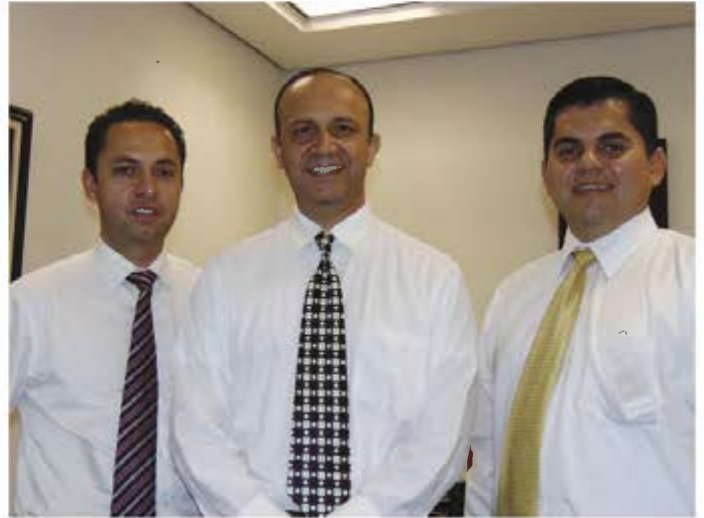
Presidencia de estaca Culiacán