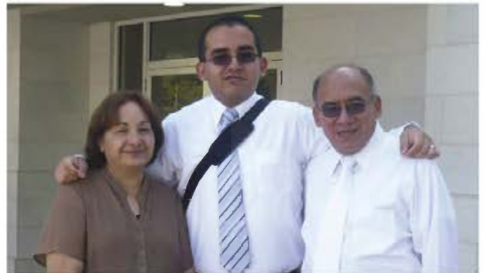
Fam. Enríquez González

Estoy agradecido con mis ancestros, los cuales no tuvieron la plenitud del Evangelio pero se nos da la oportunidad de conocerlos ahora y tener el privilegio de trabajar como familias en bien de ellos.