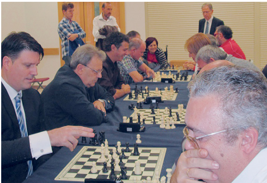
Los mayores también disfrutaron de este día jugando al ajedrez en el centro de estaca de Granada.