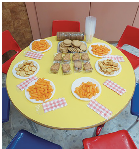
Merienda preparada para los más pequeños.