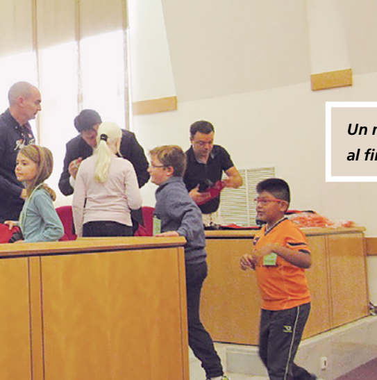
Un momento de la entrega de premios, al final de la jornada.

el Hijo y el Espíritu Santo se convirtieron en seres divinos. Asimismo, creemos que los hombres pueden lograr también la divinidad. Pero, según un discurso de la Presidencia de la Iglesia de 1912, “el Padre Eterno (Elohim) ocupa un lugar supremo y único”. Y el élder Boyd K. Packer añadió en 1985: “El Padre sí es el único Dios verdadero... Él es Elohim, el Padre. Él es Dios. Solo hay uno como Él. Reverenciamos y adoramos a nuestro Padre y nuestro Dios”. Estamos, pues, ante un Dios Supremo (Elohim), seguido jerárquicamente en un segundo lugar por el Hijo (Jehová) y, en tercer lugar, por el Espíritu Santo. Los tres forman la Trinidad, y están rodeados por seres divinos que en consejo ayudan a llevar a cabo el Plan de Salvación.