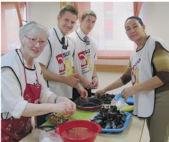
Las hermanas de la Sociedad de Socorro prepararon una paella para esta actividad.

El dualismo afirma la existencia de dos sustancias: la material (hombre)