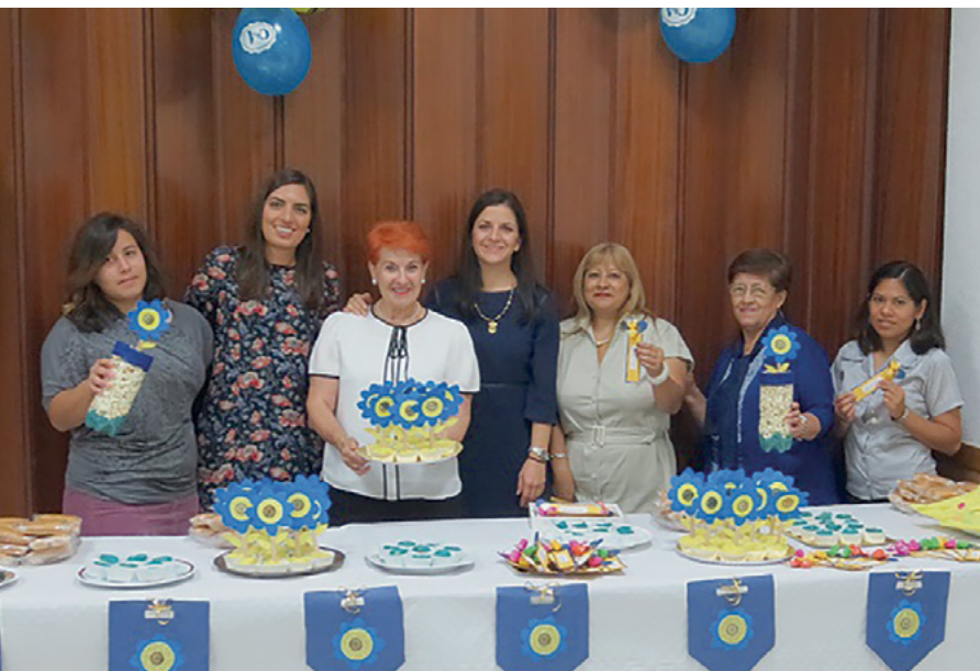
Coordinadora y supervisoras de la Sociedad de Socorro y la guardería.

Todas las asistentes recibimos una nutrida capacitación, en la que reinó el espíritu de hermanamiento y pudimos recordar que somos de valor y formamos parte de la extensión de los brazos del obispo para ayudar en la obra de nuestro Padre Celestial. ■