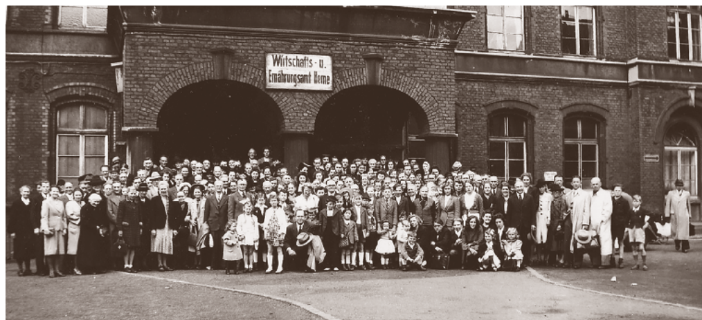
Foto tomada durante la misión de Ezra Taft Benson a Europa después de la guerra, de febrero a diciembre de 1946, para reunirse con los Santos de los Últimos Días, dirigir la distribución de los suministros de bienestar y hacer los arreglos para que se reanudara la obra misional.