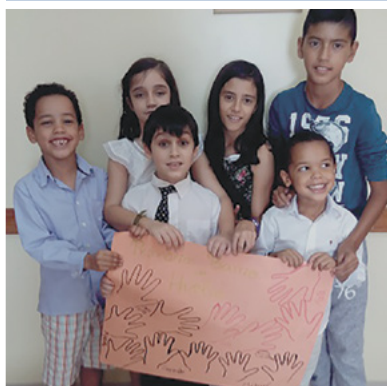
↑ El grupo de niños de la Primaria de Huelva.

¡Las manos de los niños de Huelva también ayudan! ↓