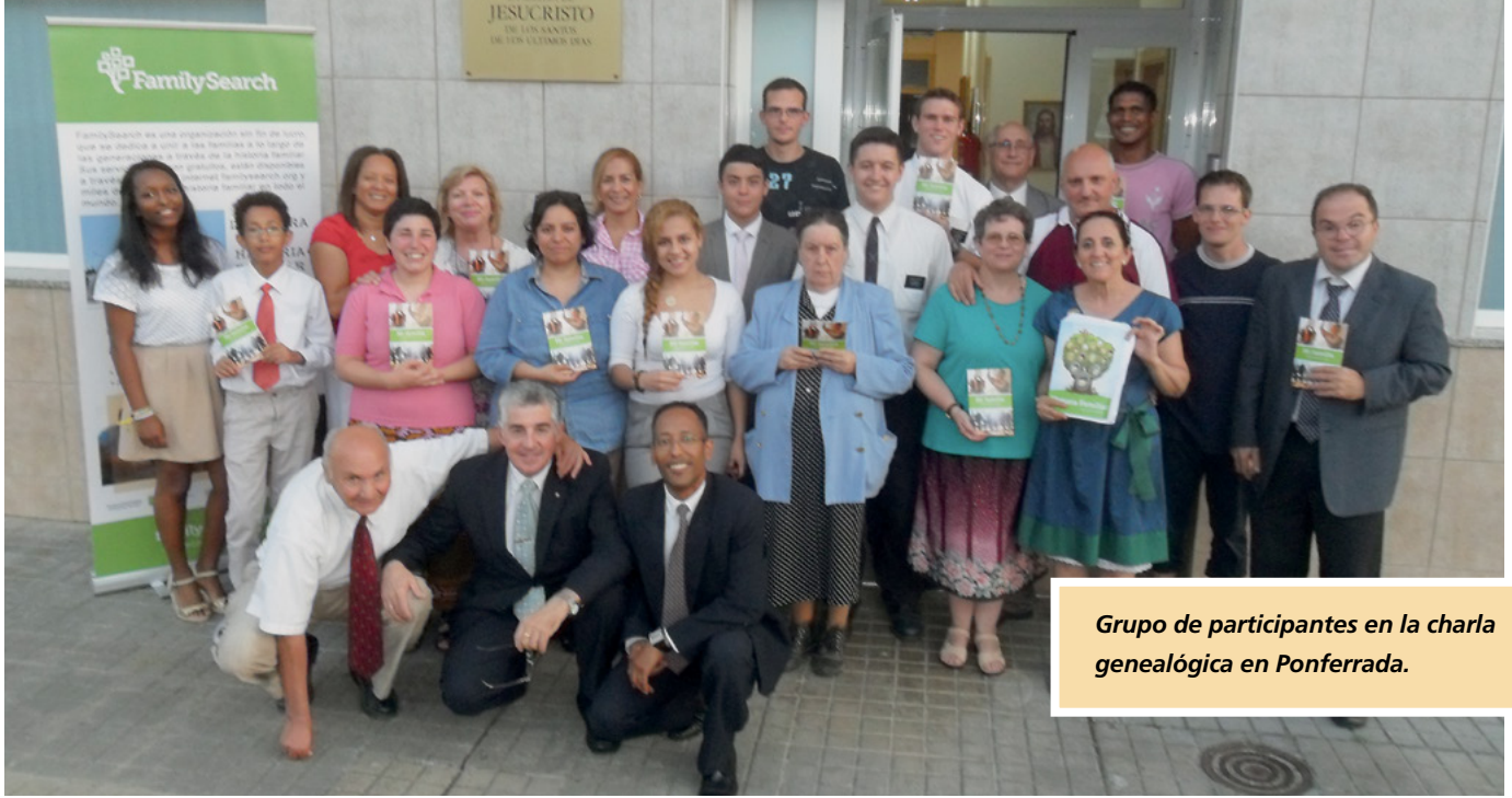
Grupo de participantes en la charla genealógica en Ponferrada.

activamente registros genealógicos en todo el mundo.