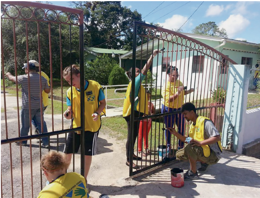
Una vez que los voluntarios recogieron la basura, pintaron las diferentes áreas del Parque de la Urbanización, entre otras actividades.

Miles de Santos de los Últimos Días de diferentes estacas, barrios y ramas del Caribe se unen en un esfuerzo solidario para aportar servicio desinteresado en lugares de su comunidad.