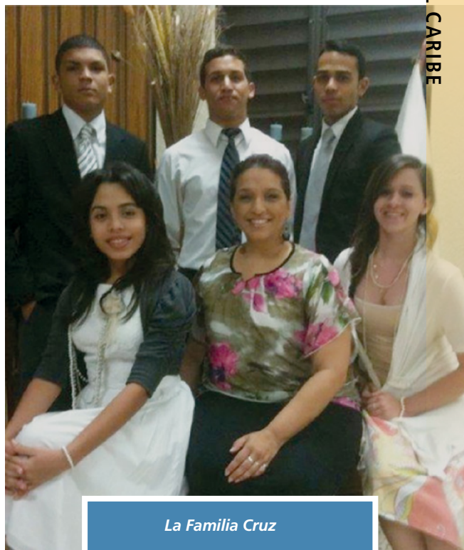
La Familia Cruz

La hermana Cruz tiene un fuerte testimonio de cómo las clases de Seminario cambian la vida de los jóvenes. “A través de estos diez años,