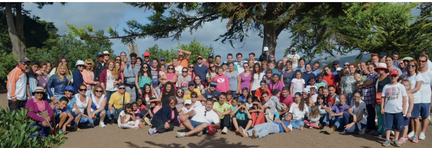
Grupo de miembros que participaron en la actividad de campo en Gran Canaria.

Este tipo de actividades nos ayudan a entrelazar los vínculos de todos los hermanos y entre las distintas unidades. También ha permitido la asistencia y hermanamiento de muchos investigadores y nuevos miembros. ■