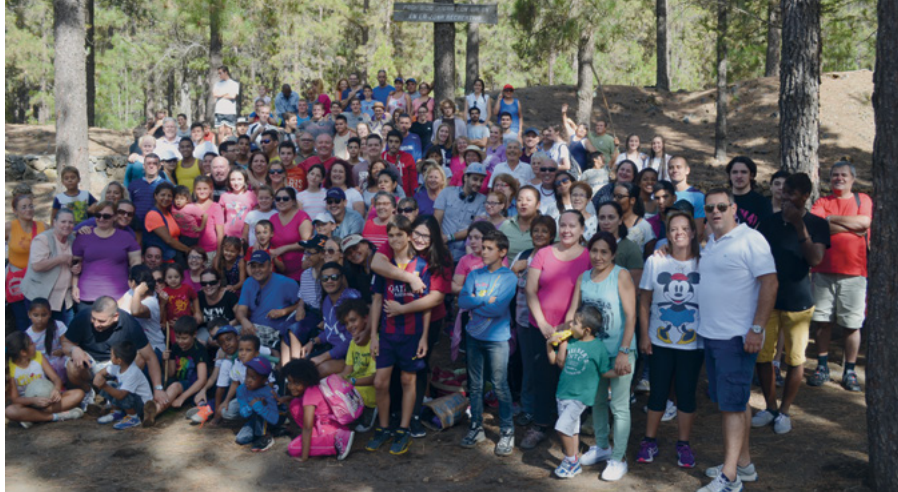
Grupo de miembros que participaron en la actividad de campo en Tenerife.

A pesar de la dificultad que conlleva ser una estaca dividida por mar, los corazones de los hermanos de las Islas Canarias están unidos en el Evangelio y el amor que emana de la expiación de Jesucristo. Las reuniones de presidencia de estaca, sumo consejo, capacitaciones y conferencias