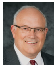
Élder Paul V. Johnson

Las oportunidades de empleo para la Iglesia se publicarán en lo sucesivo en el sitio web de la Iglesia. Se puede acceder a ellas en el enlace “Church Employment” [Empleo para la Iglesia], en la parte inferior de la página de inicio de www.lds.org . Anteriormente, se enviaban por correo notificaciones impresas a los líderes del sacerdocio para informar a los miembros de las vacantes del momento. Durante los próximos seis meses, esas notificaciones seguirán enviándose a los líderes del sacerdocio, combinadas con la publicación de las ofertas en el sitio web de la Iglesia. Más adelante, las oportunidades de empleo estarán disponibles exclusivamente en careers.ldschurch.org . Hace poco tiempo, se enviaron a las unidades de la Iglesia carteles que indicaban cómo acceder a esas notificaciones.