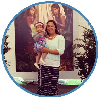
Visitantes de la "Casa Abierta" del Templo de la Ciudad de México.

Mi familia y yo nos bautizamos en 1976, cuando se anunció la construcción del Templo de la Ciudad de México. Nos preparamos para ser sellados, y aunque tuvimos muchos obstáculos, al entrar sentí la majestuosidad del templo y la reverencia del interior.