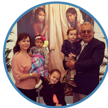
Visitantes de la “Casa Abierta” del Templo de la Ciudad de México.