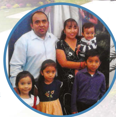
Visitantes de la "Casa Abierta" del Templo de la Ciudad de México.