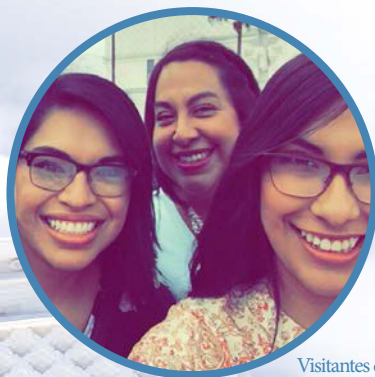
Visitantes de la “Casa Abierta” del Templo de la Ciudad de México.

En 2008, asistimos a la “Casa Abierta” del templo con nuestro hijo pequeño y unos familiares. No podía creer que mi tío estuviera en la Casa del Señor, con los ojos humedecidos por un hermoso espíritu que se sentía.