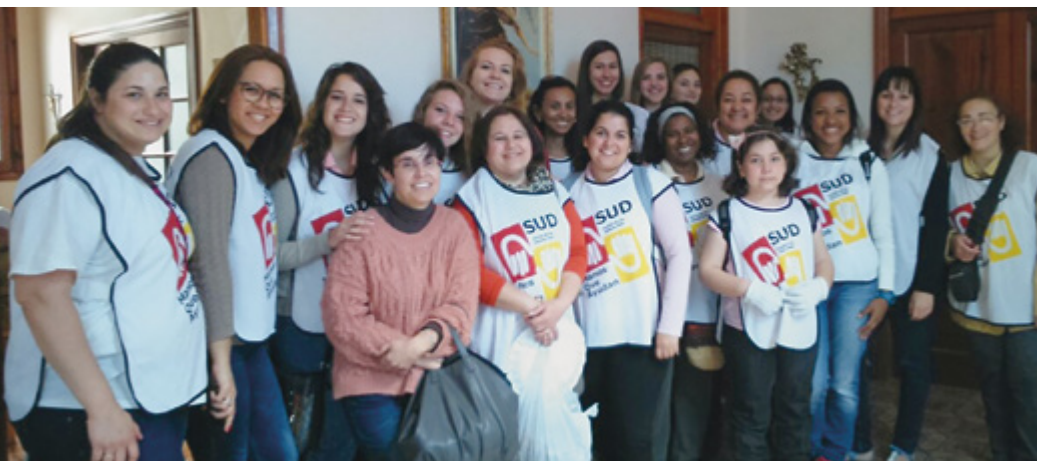
El grupo de hermanas que participó en esta actividad de servicio.