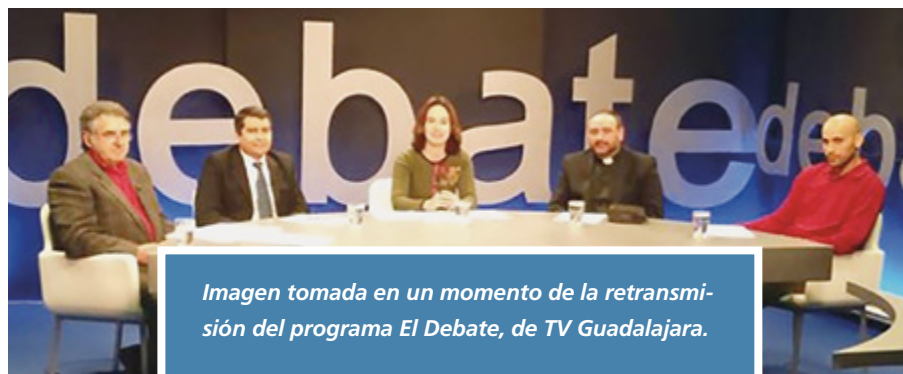
Imagen tomada en un momento de la retransmisión del programa El Debate, de TV Guadalajara.