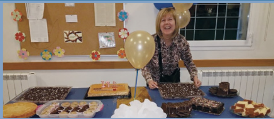
Algunas de las hermanas que prepararon esta velada de aniversario, programa, decoración y refrigerio incluidos.