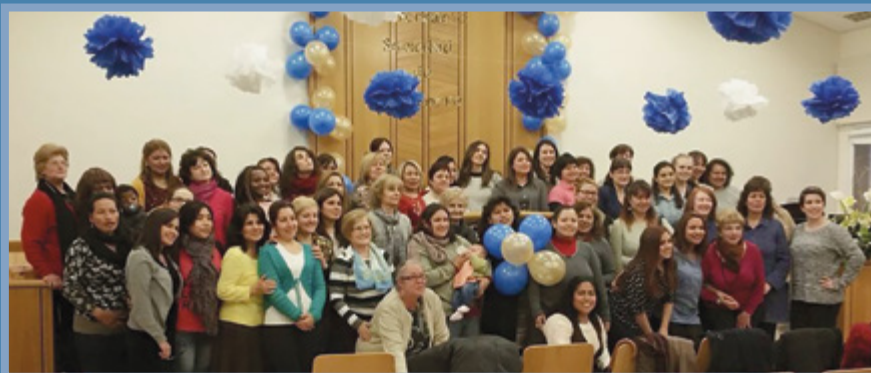
El grupo de hermanas de Sabadell que participó en esta actividad.