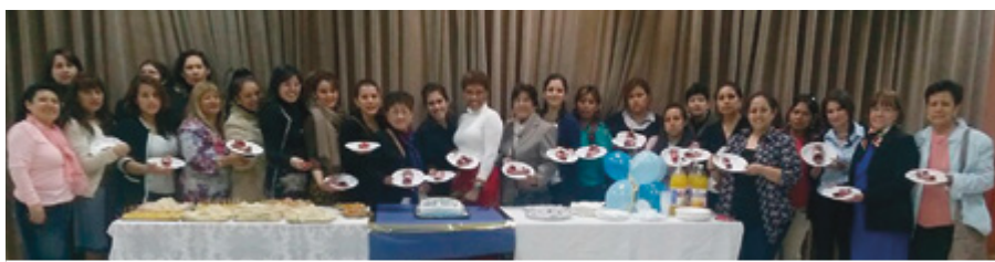
Hermanas reunidas en la capilla del Barrio Madrid 2 para celebrar el 173 aniversario de la Sociedad de Socorro.

Todas disfrutamos de un espíritu de unidad que compartimos con las personas que nos visitaron. ■