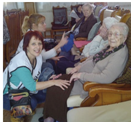
Un momento de la jornada en el Asilo de los Ancianitos Desamparados del Santísimo Cristo de La Laguna.

Fue una buena oportunidad de hermanamiento y de poner en práctica las enseñanzas del Salvador; una manera activa de demostrar que el Evangelio es una obra de amor en acción. ■