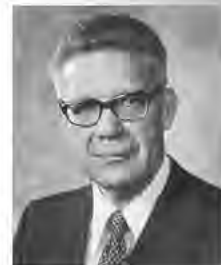
Por el élder Bruce R. McConkie Del Quórum de los Doce Apóstoles

Hace dos mil años, en las afueras de Jerusalén, había un placentero jardín llamado Getsemaní adonde Cristo y sus amigos más íntimos solían ir a meditar y a orar.