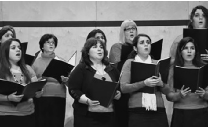
Una parte del coro.