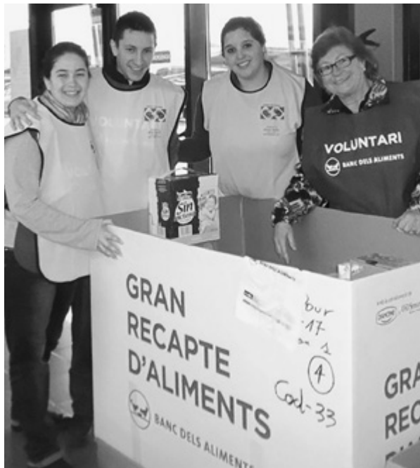
Algunos miembros se encargaron de recoger y empacar los alimentos que los asistentes llevaron para el banco de alimentos.

Todos estos alimentos se destinan a familias con niños en edad escolar que no tienen recursos para alimentarse diariamente. La lista de productos necesarios fue estimada después de la Recogida de Alimentos a nivel nacional que se hizo unas semanas antes y en la que la Estaca Lleida colaboró con voluntariado. Los productos fueron escogidos por nutricionistas para cubrir las necesidades de los niños de la ciudad de Terrassa, tras valorarse los productos de los que todavía carecían. Los miembros de las tres unidades de la estaca que colaboraron con su tiempo, amor y talento dedicaron un total de 340 horas de servicio. ■