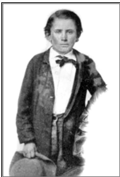
1862: Anthony W. Ivins, a la edad de 10 años.

Anthony W. Ivins fue un hombre en gran medida autodidacta, un misionero formidable, un administrador excelente y un gran defensor de los santos en México mucho tiempo antes de que se convirtiera en un apóstol y, después, uno de los consejeros del presidente Heber J. Grant. Fue misionero y explorador de la Iglesia cuatro veces (tres en México y una en Nuevo México); asimismo era un respetable hacendado y ganadero, hombre de negocios y político en el Territorio de Utah.