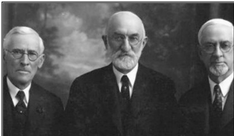
Hacia 1925: La Primera Presidencia, de izquierda a derecha, Anthony W. Ivins, Heber J. Grant, Charles W. Nibley.