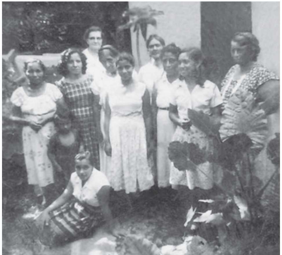
HISTORIA DEL ÁREA

hermanas inscritas, de las cuales 230 son activas. ■