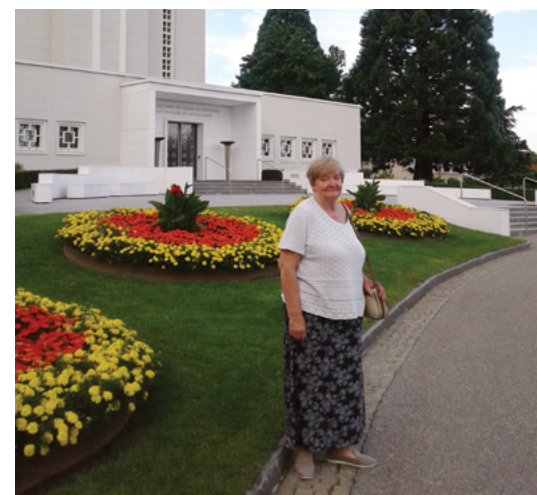
Nina pred templjem v Švici

milosti nad vsemi tistimi, ki jih je izvolil, zaradi njihove vere, da jih bo napravil mogočne prav do moči za rešitev.« Z mojem sva bila deležna Gospodovih blagih milosti. Prišli so misijonarji Cerkve Jezusa Kristusa svetih iz poslednjih dni. Bil je lep, sončen spomladanski dan in v Ljubljani na Prešernovem trgu naju je mlad misijonar ogovoril z besedami: »Za vas imam veselo novico.« Ljubezen in vztrajnost misijonarjev je v najin dom vnesla Svetega Duha, ki nama je šepetaje zbujal speča spoznanja o tem, da sva Božja otroka.