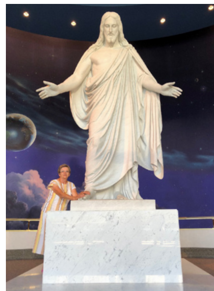
Darinka v centru za obiskovalce v Salt Lake Cityju v Utahu

Nekega dne sem videl, da po ulici prihaja smetarski tovornjak. Dobil sem dobro zamisel in stekel v shrambo. Vzel sem napolitanke in šel ven počakat smetarje, da so prišli do nas. Dal sem jim napolitanke. Vedno so prijazni do nas. Poberejo naše smeti in kadar jim pomaham, mi vedno pomahajo nazaj. Tudi jaz bom prijazen do njih. O tem govori tudi hvalnica z naslovom Prijaznost z menoj naj se začne . ■