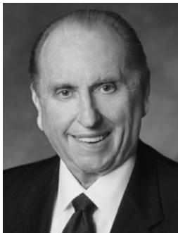
predsednik Thomas S. Monson