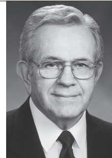
predsednik Boyd K. Packer, predsednik zbora dvanajstih apostolov