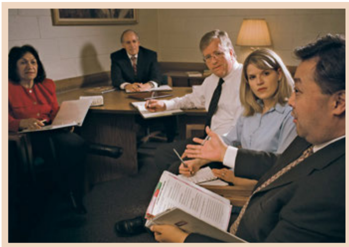
Oddelčni svet pod škofovim vodstvom razrešuje vprašanja o nudenju pomoči.

za potrebno nudenje pomoči članom. Tem voditeljem pomagajo hišni učitelji, obiskujoče učiteljice in drugi, ki imajo posebna znanja.