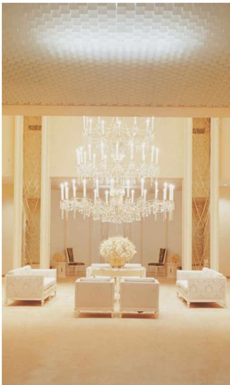
Potu Selesitila, Malumalu o Provo Iuta