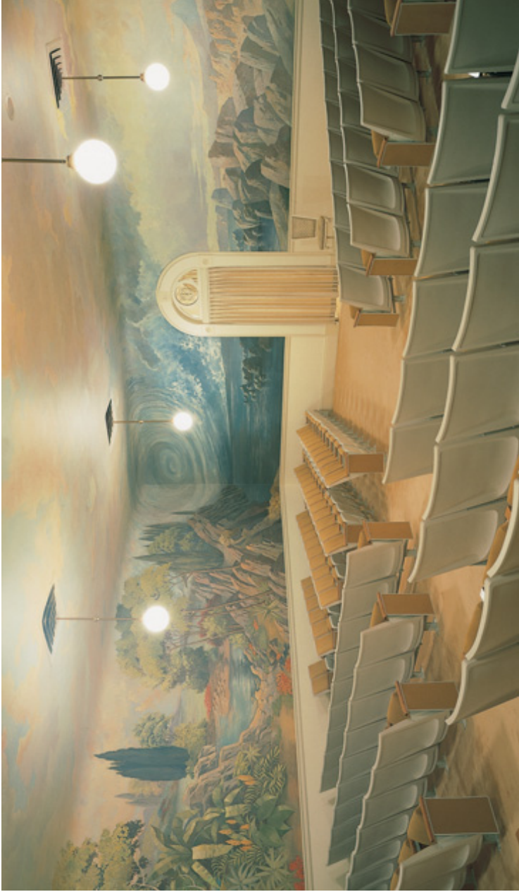
Camera Creației, Templul Salt Lake