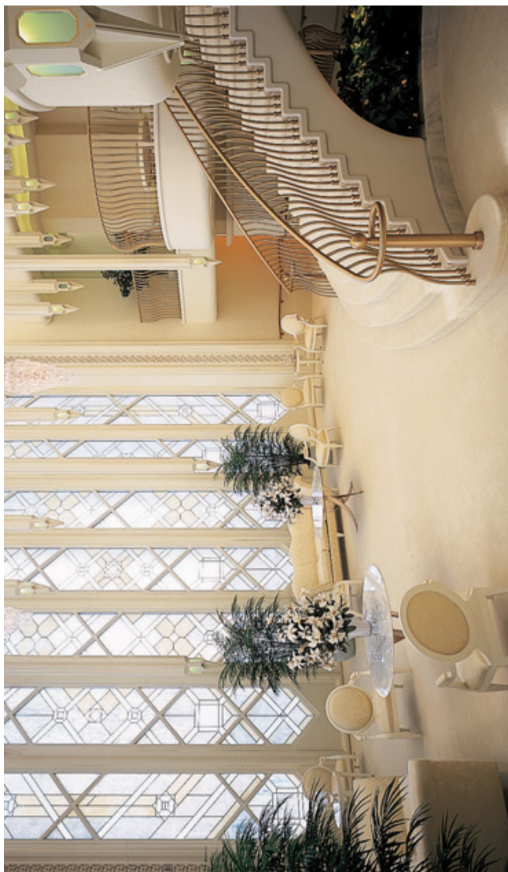
Camera celestă, Templul San Diego, California