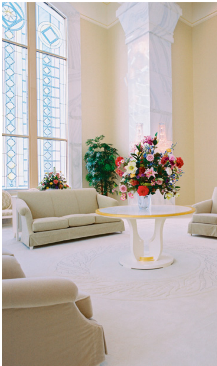
Camera celestială, Templul Columbia River Washington