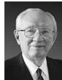
Vârstnicul Gordon B. Hinckley