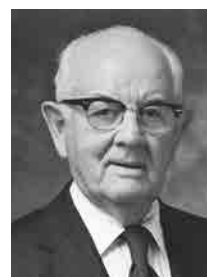
Președintele Spencer W. Kimball