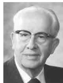
Președintele Ezra Taft Benson

pe atunci președintele Cvorumului celor Doisprezece Apostoli