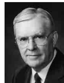
Vârstnicul M. Russell Ballard

Mă întreb dacă, în vreun fel, El, care este Stăpânul cerului și al pământului, a fost în stare să transmită inimii acelei văduve recunoștința Lui blândă și profundă pentru darul ei.