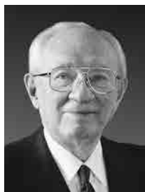
Președintele Gordon B. Hinckley