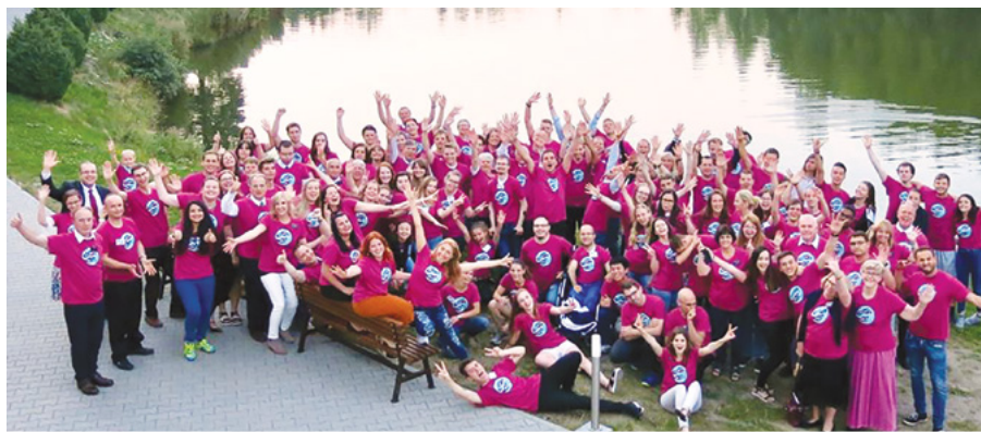
Tinerii adulți necăsătoriți care au participat la conferință

Mulți au slujit în calitate de misionari și un număr mare dintre ei se pregătesc să slujească, chiar și fără să aibă multă experiență în Biserică sau sprijin din partea familiei. Atât de mulți dintre