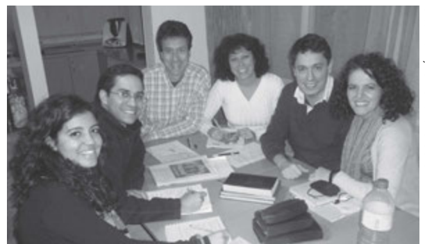
Administradores, directores de sessão e coordenadores do EFY 2012.

abençoar o seu povo e a falar com o seu profeta como antigamente. Eu amo o Pai Celestial