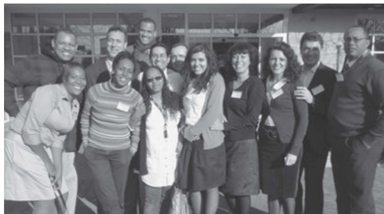
Líderes do EFY 2012 para Portugal e Cabo Verde.