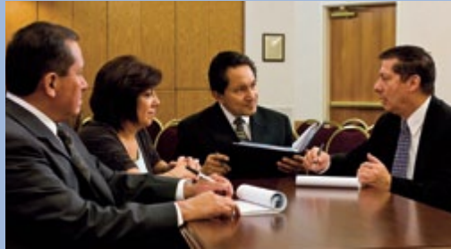
O líder do grupo de sumos sacerdotes dá orientação e designações aos consultores.