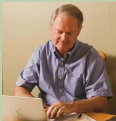
A indexação do FamilySearch abençoa a vida daqueles que fazem a indexação e a dos que usam os registros indexados.

A Indexação do FamilySearch é uma maneira de a Igreja tornar sua vasta coleção de registros genealógicos disponível ao público. Os voluntários utilizam as ferramentas à disposição em FamilySearch.org para criar índices que facilitam a pesquisa nos registros. Depois os registros indexados são disponibilizados por meio do FamilySearch.org.