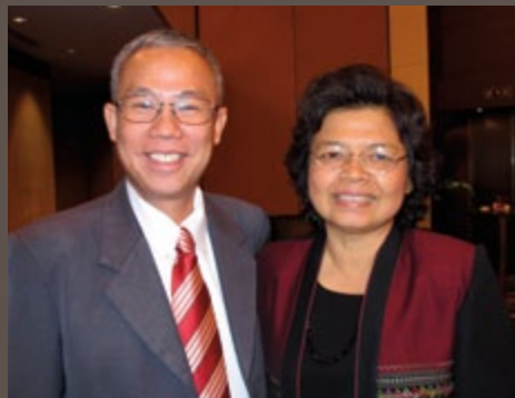
Os assessores de história da família da área são recursos valiosos aos líderes do sacerdócio e da história da família e podem ajudá-los a atingirem suas metas.

Os novos assessores de história da família da área podem cadastrar-se on-line no FamilySearch.org/serve para receberem comunicados da sede da Igreja e ter acesso a treinamentos.