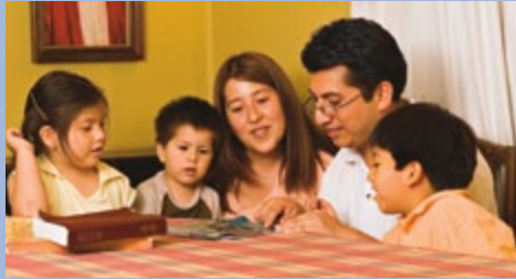
Os membros de todas as idades podem participar de algum modo do trabalho do templo e da história da família.