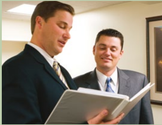
O sumo conselheiro designado coordena a história da família na estaca. Ele instrui os líderes da ala e envia relatórios regulares à presidência da estaca.

centros de história da família da estaca. Para centros de história da família multiestaca, os sumos conselheiros das estacas participantes trabalham juntos para ajudar a supervisionar os centros, providenciar consultores de história da família e fundos.