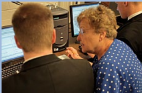
As aulas de história da família são conduzidas em forma de oficinas, nas quais os participantes têm a experiência de colocar mãos à obra e receber ajuda pessoalmente.

A aula é ensinada por um instrutor eficaz, consultor de história da família ou não. A aula pode ser ensinada durante a Escola Dominical ou em qualquer outra hora que for mais conveniente para os membros. Ela é dada sob a direção do bispado em vez do presidente da escola dominical.