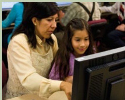
Os centros de história da família são um recurso valioso aos membros da Igreja e à comunidade.

Os centros de história da família funcionam sob a orientação do sacerdócio. O sumo conselheiro responsável pelo trabalho do templo e da história da família, sob a direção da presidência da estaca, supervisiona todos os centros de história da família da estaca.