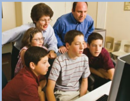
“Creio que os jovens não estão apenas dispostos e capazes de realizarem pesquisa genealógica, mas eles são meios ótimos de dar vida ao programa todo.”

Presidente Ezra Taft Benson Teachings of Ezra Taft Benson , 1988, p. 163