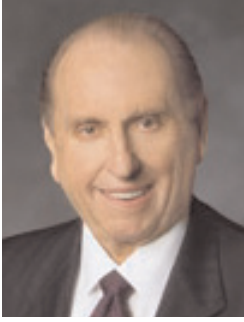
Sang President Thomas S. Monson