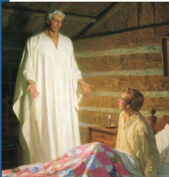
Tre år etter Joseph Smiths første syn sendte Gud engelen Moroni for å undervise Joseph om gjengivelsen av Jesu Kristi evangelium.

O m aftenen den ovenfor nevnte en og tyvende september, etter å ha gått til