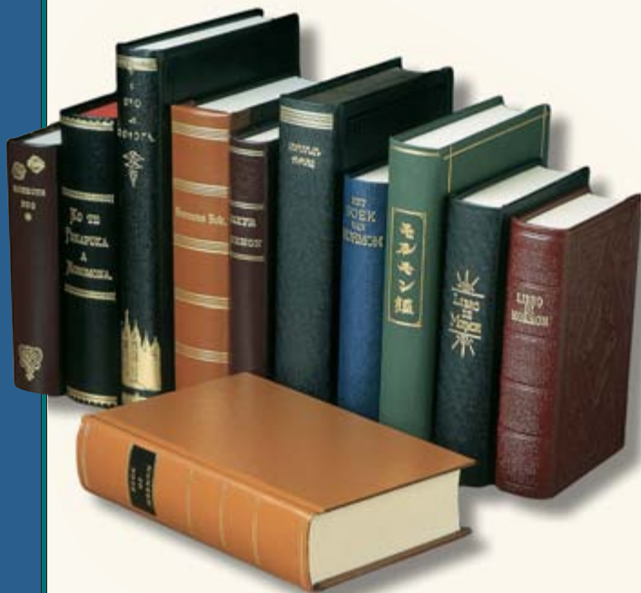
Mormons bok, som første gang ble trykt i 1830, utgis nå på ca. 120 språk over hele verden.

En mer fullstendig beretning av Joseph Smiths historie finnes i Joseph Smith – Historie i Den kostelige perle eller History of the Church, 1:2-79.