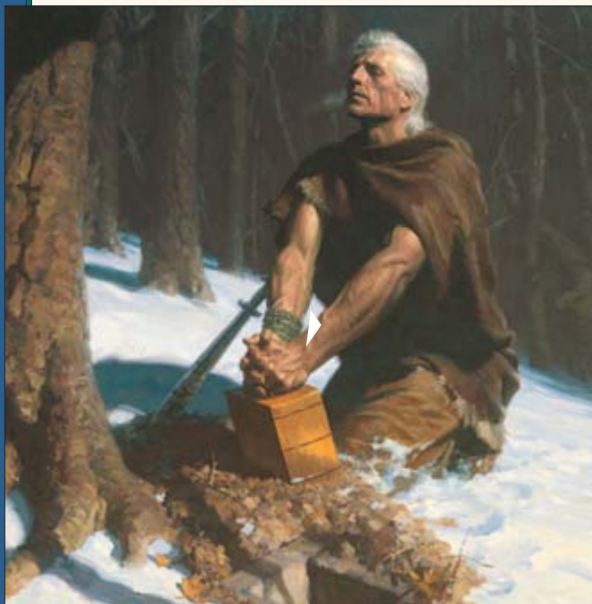
I år 421 skjulte profeten Moroni hellige opptegnelser om sitt folk i jorden på høyden Cumorah. Han kom senere tilbake som en oppstanden person og fortalte Joseph Smith om oldtidsopptegnelsene, som inneholder evangeliet i dets fylde slik det ble gitt av Frelseren til oldtidens innbyggere på det amerikanske kontinent. Denne opptegnelsen utgjør Mormons bok.

Og videre at det sammen med platene var to stener innfattet i sølvbuer — og disse stenene, som var festet til en brystplate, utgjorde det som kalles urim og tummim, og de som var i besittelse av og brukte disse stenene, ble kalt seere i fordums eller tidligere tider, og at Gud hadde beredt dem for at boken skulle oversettes.