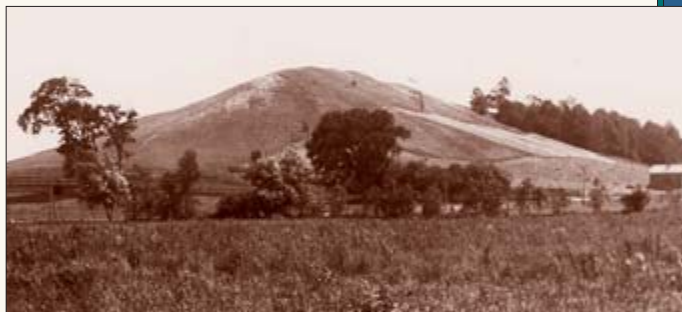
Cumorah-høyden ligger ca. 5 km sydøst for familien Smiths gård i Palmyra i New York. På Josephs tid var nordsiden dekket av gress, mens det på sydsiden vokste store trær og småskog. Platene var gravd ned på sydvestsiden, ikke langt fra toppen. Fotografi: August 1907

Alt dette hadde nå gjort så sterkt inntrykk på meg at søvnen helt hadde forlatt meg, og jeg var overveldet av forbauselse over det jeg både hadde sett og hørt. Men hvor overrasket ble jeg ikke da jeg igjen så det samme sendebud ved min seng og hørte ham fortelle og gjenta det samme som han hadde