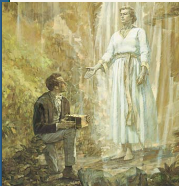
Moroni vendte tilbake én gang i året i fire år og ga ytterligere undervisning til den unge profeten. Da de fire årene var omme, mottok Joseph platene og begynte å oversette Mormons bok.

Like etterpå sto jeg opp og tok som vanlig fatt på dagens nødvendige gjøremål, men da jeg forsøkte å arbeide slik jeg pleide,