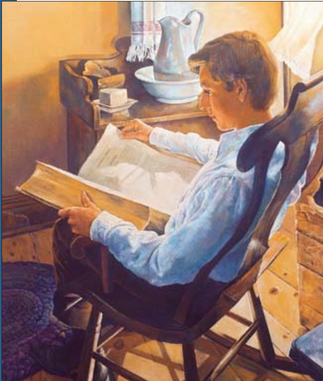
Mens Joseph prøvde å ta stilling til hvilken kirke han skulle slutte seg til, vendte han seg til Bibelen for å finne veiledning. Der leste han: «Be til Gud.»

Fra den dagen av arbeidet Joseph iherdig i Guds tjeneste. Han arbeidet for å opprette Jesu Kristi Kirke av Siste Dagers Hellige og bygge opp Guds rike på jorden i de siste dager. Trofaste medlemmer av Kirken vitner om at Jesus Kristus er verdens Frelser og Forløser. Jesus leder sin kirke i dag ved åpenbaring til en profet på jorden. Joseph Smith var en slik