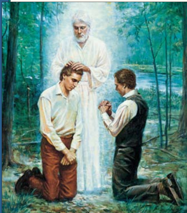
Joseph Smith og Oliver Cowdery mottok Det aronske prestedømme ved håndspåleggelse av døperen Johannes 15. mai 1829.

V i holdt fremdeles på med oversettelsesarbeidet da vi en dag i den påfølgende måned (mai 1829) gikk ut i skogen for å be og adspørre Herren angående dåp til syndenes forlatelse som vi fant nevnt i