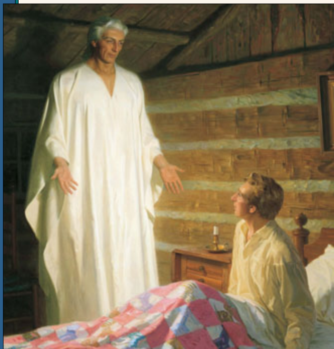
Иосеф Смитийн Анхны Үзэгдлээс хойш гурван жилийн дараа Бурхан түүн рүү Есүс Христийн ариун сургаалыг дахин сэргээх талаар заавар өгөхөөр тэнгэрийн элч Моронайг илгээсэн.

Иосеф Бурханыг харснаа үгүйсгэхээс татгалзсан тул хавчлага үргэлжилсээр байлаа. 1823 оны 9-р сарын 21-нд Иосеф унтахынхаа өмнө Бурханы өмнө өөрийнхөө байр суурийг мэдэхийг хүсэн залбирав. Тэгэхэд тэнгэр элч Моронай түүнд үзэгджээ.