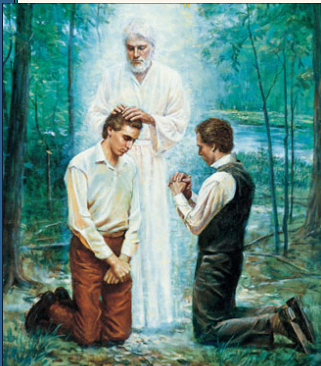
1829 оны 5-р сарын 15-нд Иосеф Смит, Оливер Каудри хоёр Иохан Баптистаар гар тавиулан Аароны Санваарыг хүлээн авчээ.

Б ид орчуулгынхаа ажлыг үргэлжлүүлж байх явцдаа ялтсуудын орчуулгад дурдсанаас мэдэж авсан нүглүүдийн ангижралын төлөөх баптимсын талаар Их Эзэнээс асууж, залбирахаар дараа сарын (1829 оны Тавдугаар сар) нэгэн өдөр ой руу явцгаасан юм. Бид Их Эзэнийг дуудан залбирч байх үед тэнгэрээс цацарсан үүлэн дээр буй элч бууж ирээд бидэн дээр гараа тавин томилохдоо ийнхүү хэлсэн юм: