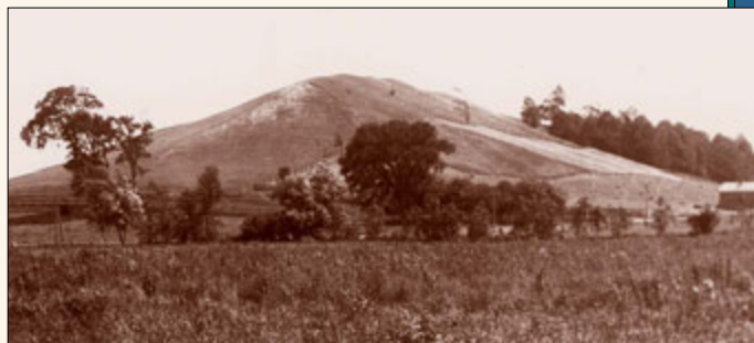
Күмора Толгой нь Нью-Йоркийн Пальмира дахь Иосефийн аж ахуйгаас зүүн урагшаа ойролцоогоор гурван милийн зайтай байдаг. Иосефийн үед хойд хэсгийнх нь төгсгөл хэсэг нь тал хээр газар ба өмнөд хэсэг нь сийрэгхэн ой модтой газар байлаа. Гэрэл Зураг: 1907 оны 8-р сар.

Энэ үед сэтгэл минь маш их хөдөлснөөс нойр минь хулжин одож, өөрийн үзсэн сонссоныг гайхан биширч бодолд автан хэвтэж байлаа. Энэ үед нөгөө элч орны минь дэргэд дахин ирсэн байхыг хараад бүр гайхаж орхисон ба тэр өмнө хэлсэн бүх зүйлээ дахин давтаад, үүн дээрээ нэмэн Сатан намайг баяжих зорилгоор (эцгийн минь гэр бүлийн ядуу тарчиг байдлаас