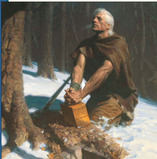
МЭ 421 онд бошиглогч Моронай ард түмнийхээ ариун бичээсийг Кумора Толгойд булжээ. Тэр дахин амилан эргэж ирээд Иосеф Смитэд Америк тивийн эртний оршин суугчдад Аврагчийн өгсөн сайн мэдээний бүрэн дүүрэн байдлыг агуулсан эртний бичээсийн тухай хэлэв. Тэр бичээс нь Мормоны Ном юм.

Энэ бүгдийг хэлснийхээ дараа тэр Хуучин Гэрээний бошиглолуудаас иш татан ярив. Тэр эхлээд Малахийн гуравдугаар бүлгээс иш