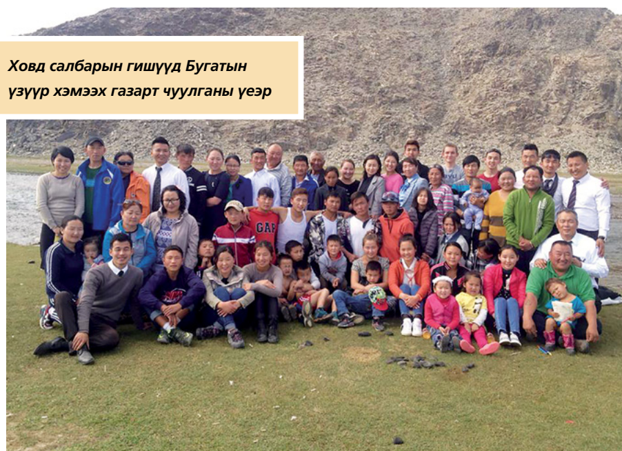
Ховд салбарын гишүүд Бугатын үзүүр хэмээх газарт чуулганы үеэр

Эхний өдрийн чуулган Бугатын үзүүр хэмээх газар болсон бөгөөд Ховд салбарын нийт гишүүд, удирдагчид оролцсон. Тэд Гадасны удирдагчдын заасан сүнслэг өртөөнүүдээр аялж, олон зүйл сурсан. Зарим гишүүнтэй уулзаж, сурсан зүйлийнх нь тухай сонирхлоо.