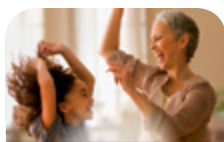
Миний гэр бүл

Унш: Миний суурь товхимол нь бие даах чадвар хөгжүүлэх бүлгийн цугларалтуудын нэг чухал хэсэг юм. Эдгээр цугларалтад оролцдог, амлалтуудаа биелүүлдэг бүлгийн гишүүдэд ХҮГ Бизнес коллежээс гэрчилгээ хүлээн авах боломж бүрдэнэ. Гэрчилгээ хүлээн авахад тавигдах шаардлагуудыг харах бол 29-р хуудсыг гаргана уу.