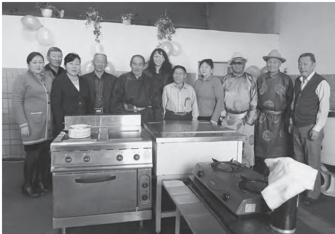
Булганы ахмадын сувилал дээр