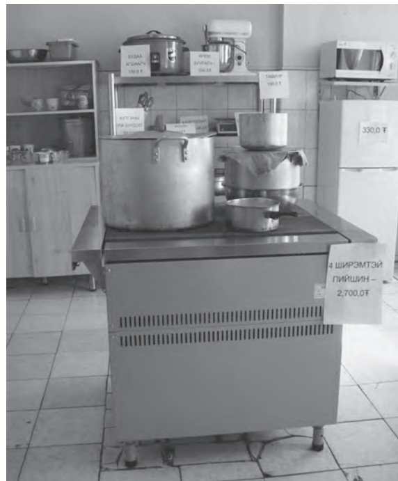
Шинэхэн 4 ширэмтэй пийшин