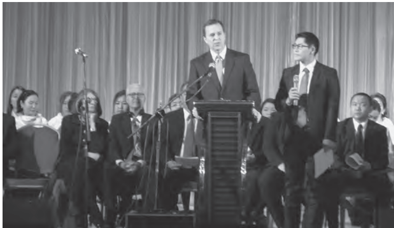
Ерөнхийлөгч Томпсон шинэ өөрчлөлтүүдийг танилцуулав

нийт сүмийн 900 гаруй гишүүн оролцлоо. Ерөнхийлөгч Вилсон ба түүний эхнэрийг үг хэлсний дараа ерөнхийлөгч Одгэрэл, ерөнхийлөгч Томпсон нар зохион байгуулалтын өөрчлөлтийг тодорхой танилцуулав. Улаанбаатар хотод УБ Баруун Гадас ба Зүүн Дүүрэг гэсэн зохион байгуулалт хэвээр байх боловч харин салбар, тойргуудын хил хязгаарт өөрчлөлт орж, шинээр Жаргалант ба Америкийн дэнж салбарууд бий болж, зарим тойрог ба салбарууд хил хязгаарын өөрчлөлтийн улмаас хуваагдав. Энэ бүхэн Бурхан амьд, Түүний сайн мэдээ үнэн гэдгийг мөн Түүний сүр хүчийг илтгэн харууллаа.