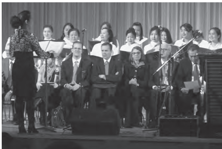
Гадасны найрал дуучид дуулав