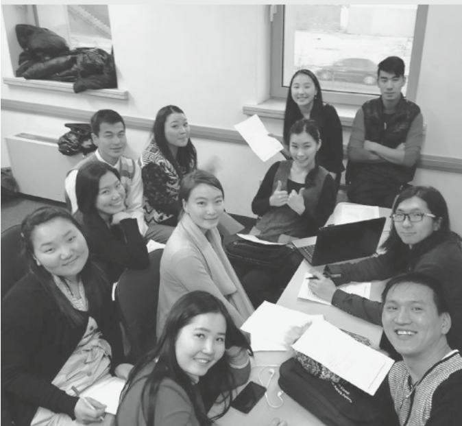
Сүмийн MEFY багийнхан

Сайн мэдээний зарчмын дагуу амьдарч буй хүн байнга зөв шударга, зохистой зүйлсийг эрэлхийлж, өөртөө болоод орчин тойрондоо зөвийг түгээхийг хичээж байдаг. Үүний нэг жишээ бол сүмийн хэсэг залуус санаачлан залуучуудын дунд “MEFY” (Mongolian Especially For Youth) буюу Монголын өсвөр үеийнхэнд зориулсан эерэг нөлөө бүхий дуу, бүжиг, жүжигчилсэн тоглолтыг хамарсан төсөл хэрэгжүүлж, залуусын авьяас билгийг идрүүлэн, хамтдаа зохистой дуу хөгжим сонсож, цагийг зөв зохистой өнгөрөөх үйл ажиллагаануудыг явуулж байна. Тэд анхныхаа дууны клипийг гаргаад байгаа бөгөөд тэдний үйл ажиллагаа болон дуут youtube дээрээс үзэж болно. Та нар youtube.com гэж ороод mefy гэж хайхад л болно. Залуустаа амжилт хүсье. ■