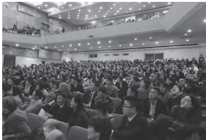
Сүмийн гишүүд талархал, итгэлтэй хүлээн авав

Христийн сайн мэдээний бүрэн байдал Монгол оронд анх түгэн дэлгэрснээс хойш 21 жил өнгөрч байна. Энэ хооронд Түүний сургаал өргөн цар хүрээтэй түгэн дэлгэрч, гишүүдийн тоо өсөн нэмэгдэж мөн цаашид гадаснуудын зохион байгуулалтад орох, Бурханы ариун өргөөг