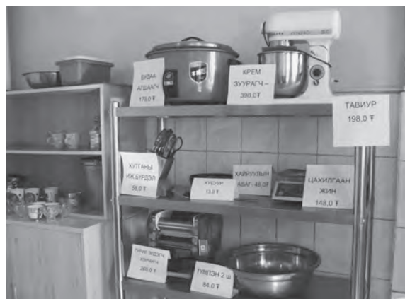
Гал тогооны хэрэгслүүд