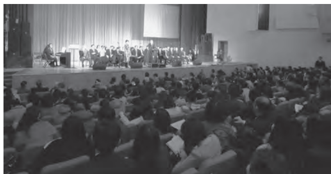
Гадас ба Дүүргийн хамтарсан чуулган