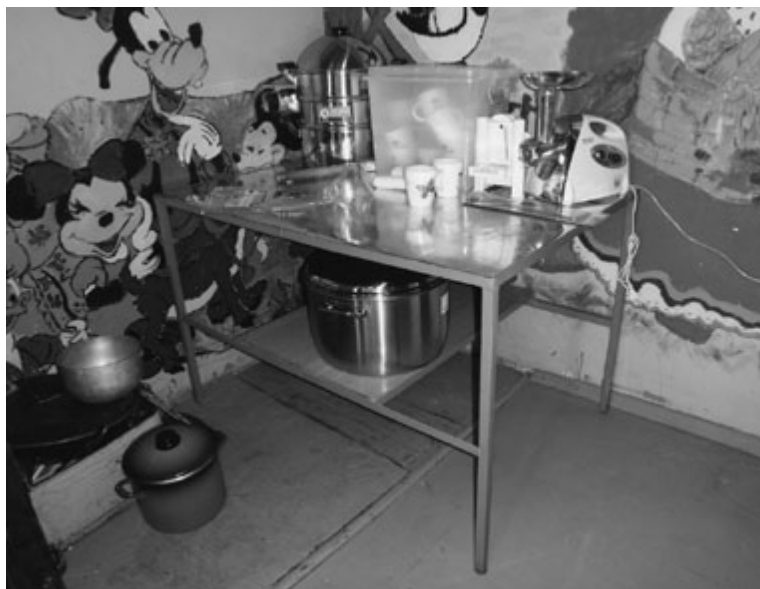
Бяцхан гал тогоо