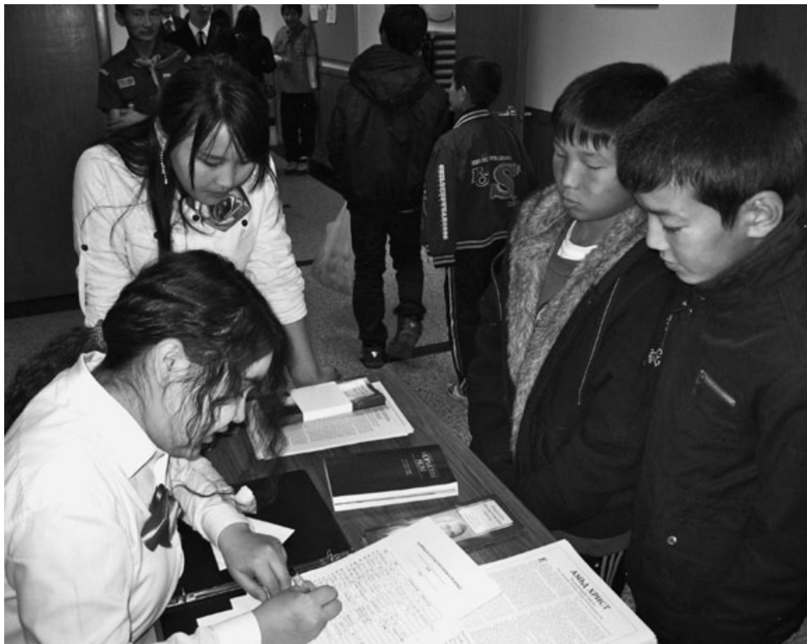
Олон сонирхогчидтой боллоо

Нээлттэй өдрөөр сүмийн гишүүд хөнгөн зууш бэлтгэн тавьсан байлаа. Ирсэн зочид маань тэдгээрээс амсан талархаж байв. Салбарын гишүүд болоод бүрэн цагийн номлогчдын бэлтгэл болон уйгагүй үйлчлэлийн хүчээр үйл ажиллагаа маш их амжилттай болж өнгөрлөө. Та нарынхаа гайхамшигтай үйлчлэлд баярлалаа. ■