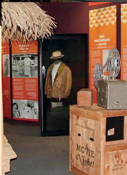
PUBLIC AFFAIRS LIBRARY

Elōñļok jān 70 men ko bwinnid kar jilkintok jān Salt Lake City nān maroñ kobaiki ilo kaloojoj in ekāāl barāinwōt ko jet kar kōkñj nān indeeo. Rekar kobaļok IPPAN elōñļok jān 500 rekoot ko kar aini im men ko bwinnid jet emōj kar kōjparok ilo laļ kein im kiiō rej pād ilo centre eo ekāāl.