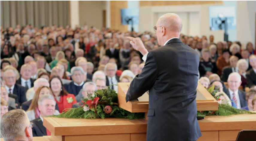
Büreejtön Henry B. Eyring, rikakpilöklök eo kein kajuon ilo Büreejtönji eo Kein Kajuon, ekar päd ilo New Zealand ñan aje David O. McKay Stake and Culture Events Centre eo ekääl im mōko jet im jikin jermal ko jet.

in kōmmani jermal ko an tampeļ bwe jen maroñ liāp. Armej renaaj itok ñan Centre in, eļaptata armej ro me rej jān eria in, im bōk eñjake ko remmān ilo jetōb. Imaroñ pijaik armej ro ilo laļ eo an jetōb rej kabokbok!