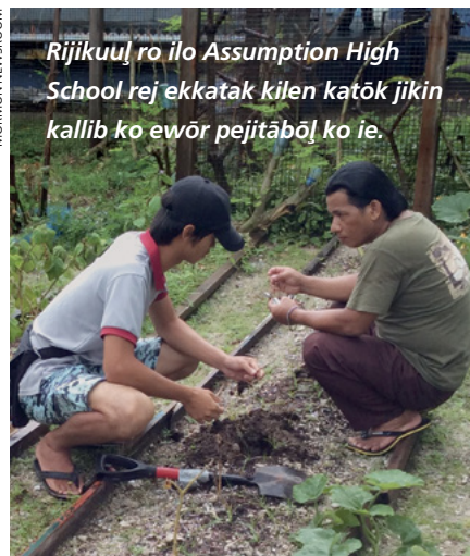
Rijikuuļ ro ilo Assumption High School rej ekkatak kilen katōk jikin kallib ko ewōr pejitābōļ ko ie.

Jipaṅ ko jān LDS (mennin jipaṅ ko jān Kabuṅ eo an Jisōs Kraist im Armej ro Rekwojarjar ilo Raan-ko Āliktata) im Taiwanese Technical Farms (TTF) im Canvasback Wellness Center jermal ṅan kajjieoṅ leļok bwidej eo eṁōj kūṅe im ine ko ṅan jikin kallib in an jikuuļ in. Jukjukin pād in ej kōmṁṁane ijo koṅaer ilo aer aiintok pāp in nii ko me rej jāniji ippān TTF ṅan bwidij in jikin kallib.