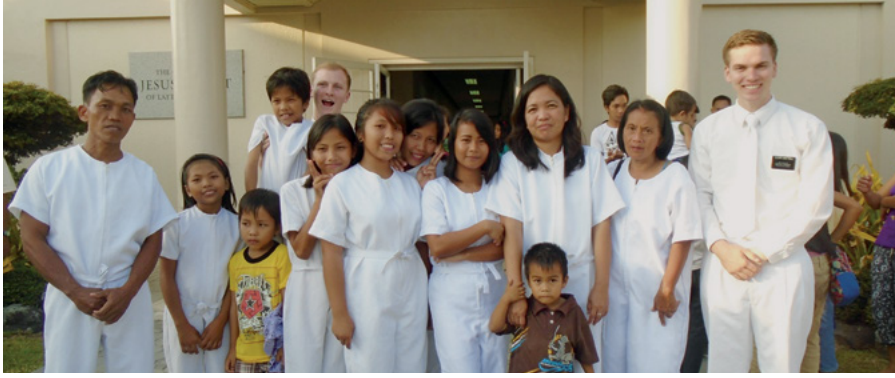
Mary Ann im baamle eo an āliktata rekar peptaj tok n̄an Kabuñ eo an Jisōs Kraist im Armej ro Rekwojarjar ilo Raan-ko Āliktata

juon em̄ oran. Juon ikkur “tao po” im juon kōllāllā tokālik, juon kōrā ekar karuwaineneik er bwe ren delōñ. Ium̄win wōt jejo minit ko n̄an katakin, rekar katakin juon katak kōn Anij im baamle im Jeplaaktok eo. Liin ekar loḷok m̄weo raan eo ak liin ekar leḷok attōreej eo an im errā bwe remaroñ in loḷok baamle eo an Wōnje eo.