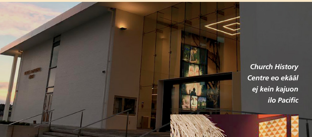
Church History Centre eo ekāāl ej kein kajuon ilo Pacific