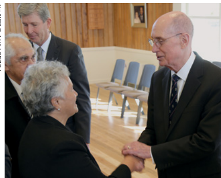
Büreejtön Eyring ej iakiakwe mijenede ro jermal

Innām Eyring ekar etal wōt im alooje 200 Armej ro Rekwojarjar rej ikkure