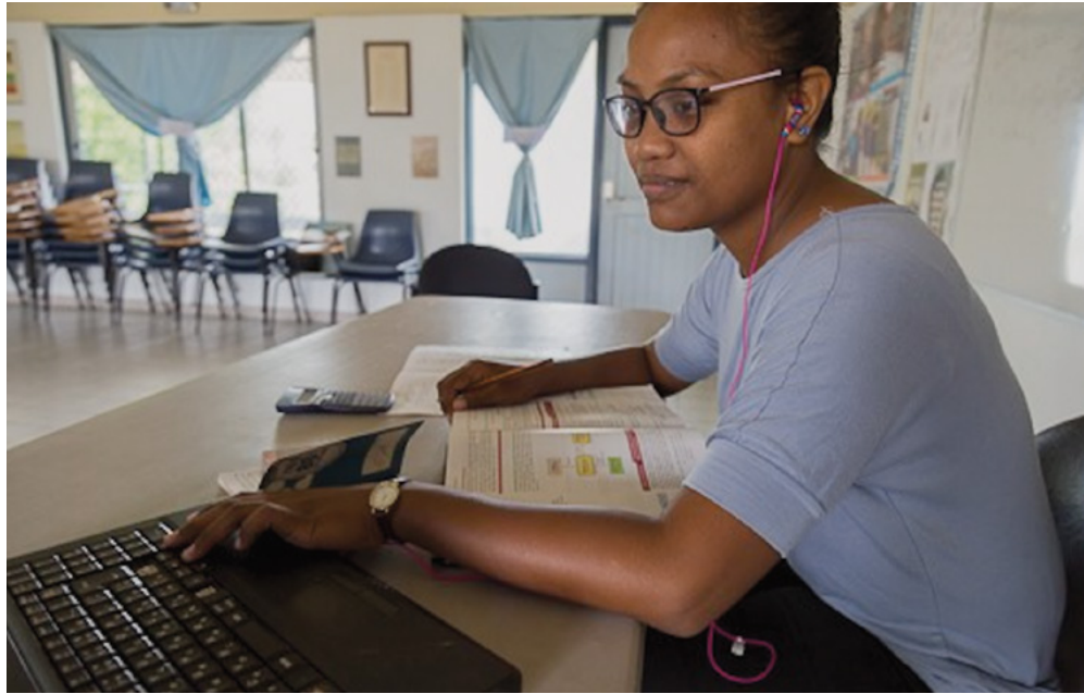
“Nān jipañ jukjuk in pād eo aō eaar juon ettōņak aitok kitien nān eō.”

Bōtaab ejjab aolep in! Lyalyn eaar katak ekōjkan nān erom juon home-maker. Kajjojo jibboñ liin ej karreoiķ m̄weo im kōm̄mane jerbal ko an mōkta jān an em̄makūt nān kaļōj jeļā bwe jerbal ko an rej kōjeraam̄man aolepān baam̄le eo an. ■