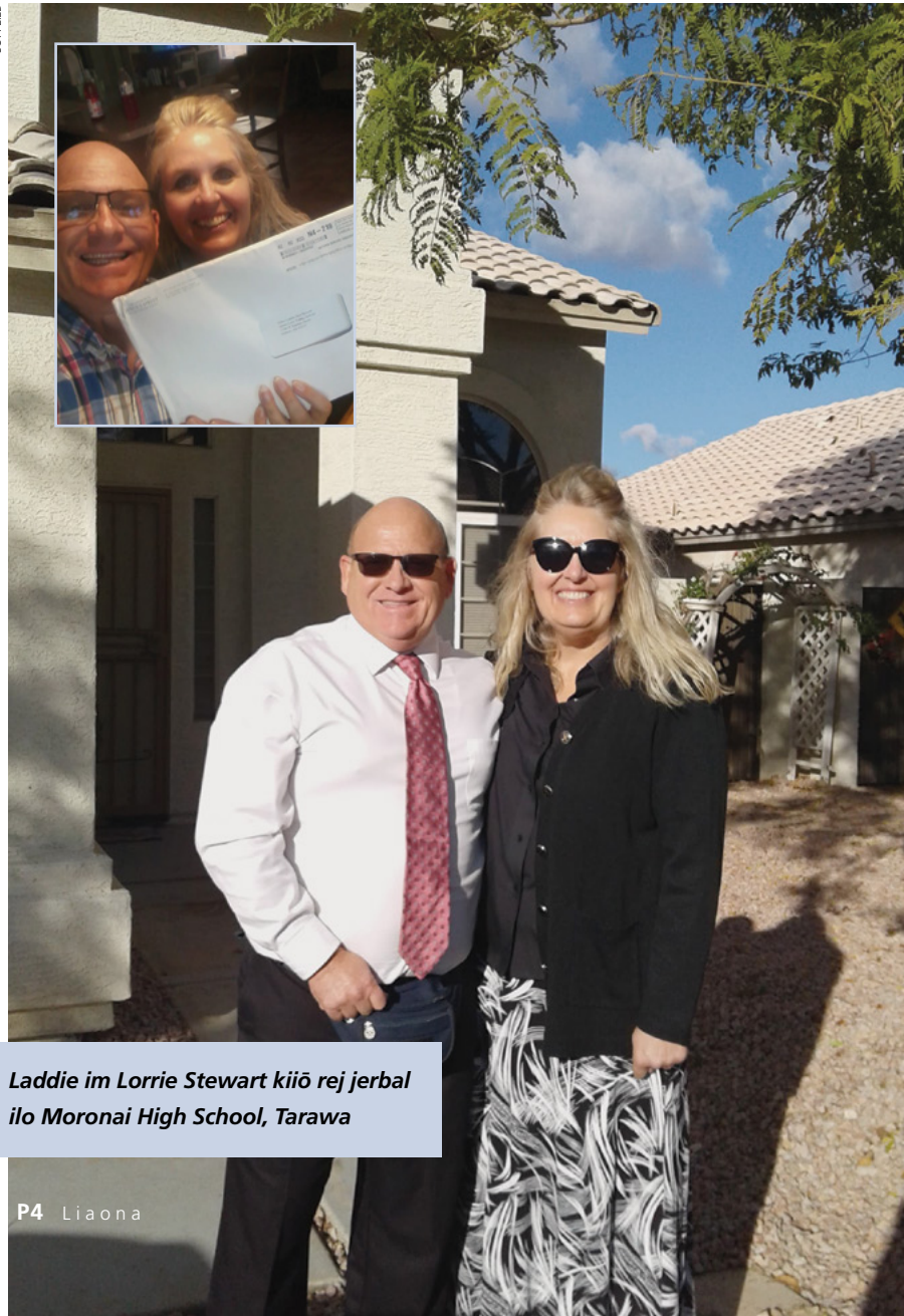
Laddie im Lorrie Stewart kiiō rej jermal ilo Moroni High School, Tarawa