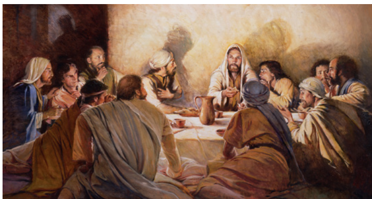
Rilōmōḷor eo ekar kwaḷōk kadkadin kwojkwōj eo.

“Men in ej kūrṃool in kien ko Aō, im men in ej kamool ñan Jemān bwe komṃj mōñōñō in kōmṃan men eo Iaar jiroñ komṃ.