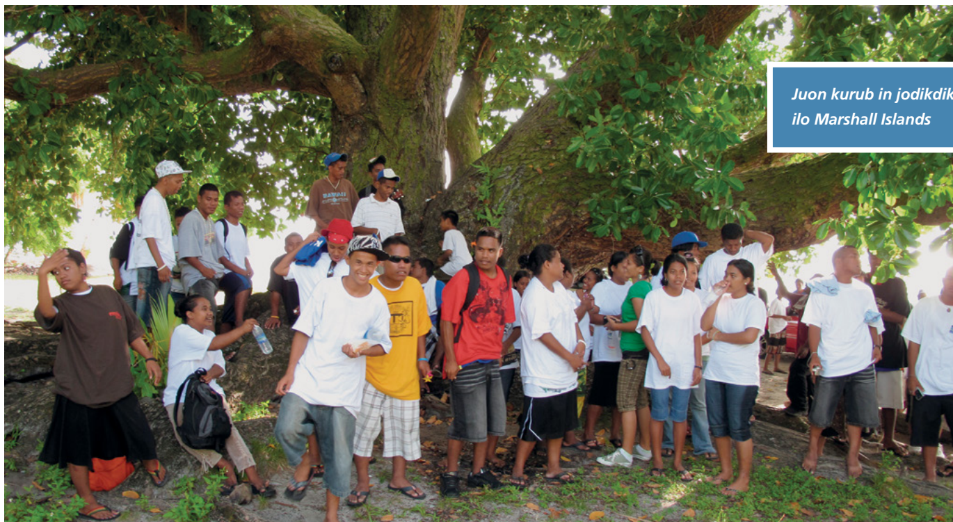
Juon kurub in jodikdik ilo Marshall Islands

an ilo Jabōt ñan kōmṃani bwe ren ejetōbtōb. Ej kate bwe en mōkaj an rōḷ ilo Raan in Jabōt bwen joḷok iien ko remṃan im kautiej Raan in Jabōt ippān baamḷe eo an.