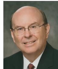
Elder Quentin L. Cook