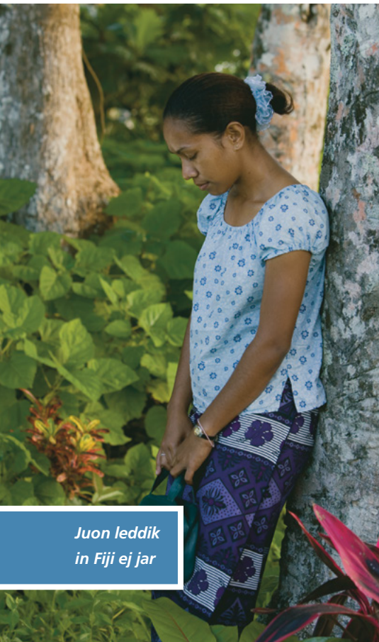
Juon leddik in Fiji ej jar