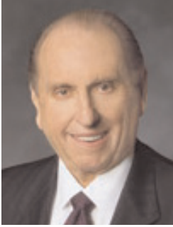
Jen Būreejtōn Thomas. S. Monson