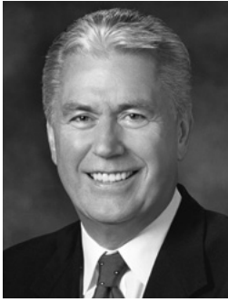
Oleh Presiden Dieter F. Uchtdorf Penasihat Kedua dalam Presidensi Utama