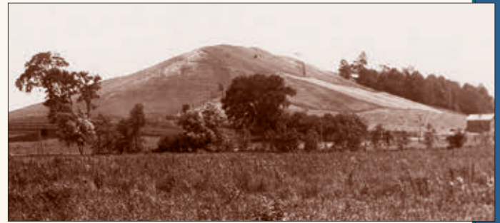
Bukit Kumorah terletak lebih kurang tiga batu ke arah tenggara dari ladang keluarga Smith di Palmyra, New York. Pada masa Joseph, hujung utara ditutupi dengan rumput, bahagian selatan ditutupi dengan kelompok-kelompok hutan. Lempeng-lempeng itu telah ditanam di bahagian barat, tidak jauh dari bahagian atas bukit itu. Foto: Ogos 1907

Pada waktu ini, begitu mendalam kesan-kesan yang tertinggal di dalam fikiranku, sehingga tidur telah lari dari mataku, dan aku berbaring dilanda kehairanan oleh apa yang telah aku lihat dan dengar. Tetapi yang menghairankan aku ialah ketika