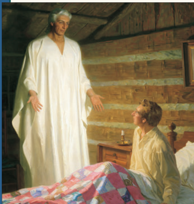
Tiga tahun selepas Penglihatan Pertama Joseph Smith, Tuhan menghantar malaikat Moroni untuk mengajar Joseph berkenaan pemulihan Injil Yesus Kristus.

Penganiayaan berterusan apabila Joseph enggan menafikan bahawa dia telah nampak Tuhan. Pada 21hb