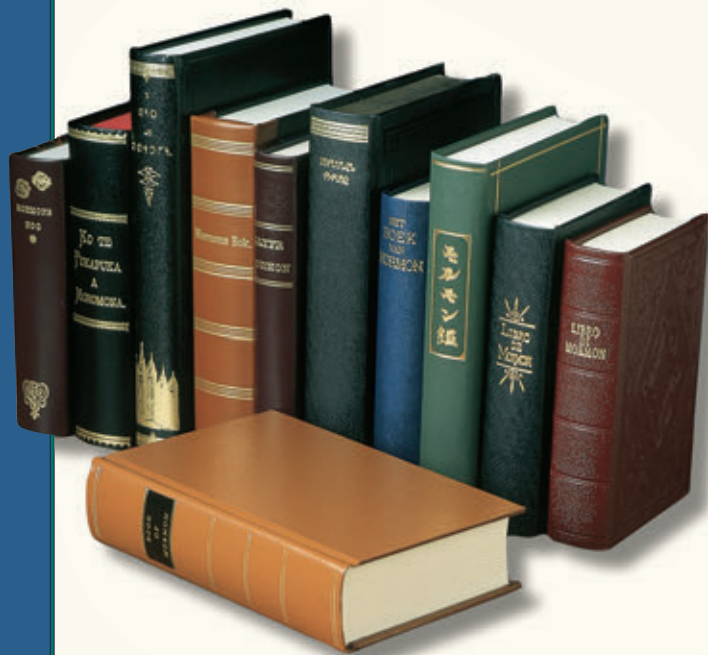
Kitab Mormon, dicetak buat pertama kali pada tahun 1830, kini sedang diterbitkan dalam lebih daripada 100 bahasa di seluruh dunia.

Untuk catatan kisah Joseph Smith yang lebih lengkap, lihat Joseph Smith—Sejarah di dalam Mutiara yang Sangat Berharga atau History of the Church (Sejarah Gereja), 1:2–79.