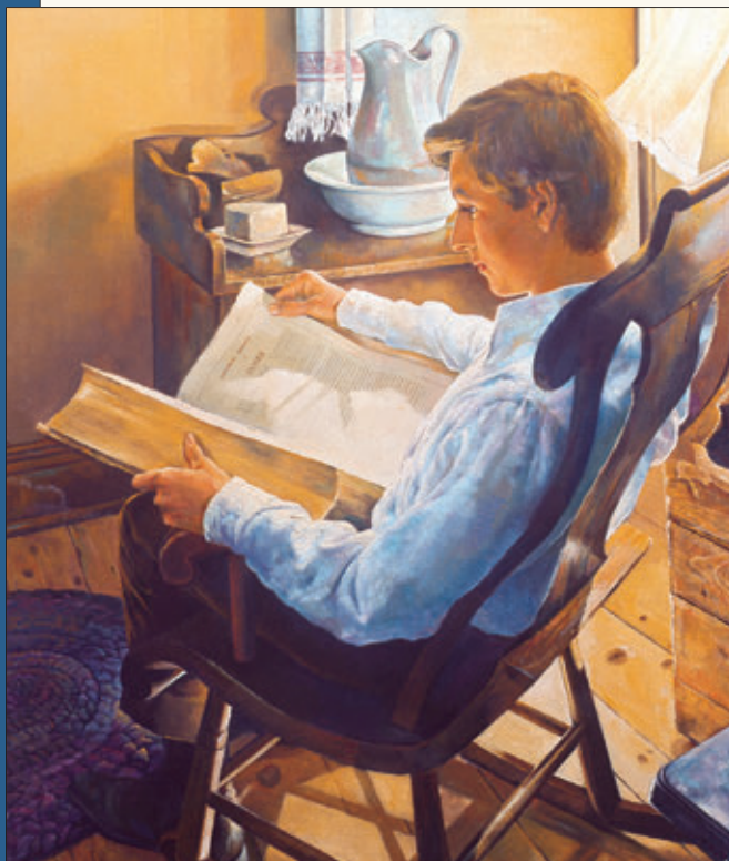
Ketika membuat keputusan berkenaan gereja yang mana dia patut sertai, Joseph berpaling kepada Alkitab untuk mendapat bimbingan. Dalam Alkitab, dia terbaca, "Tanyalah kepada Tuhan."

Sejak hari itu, Joseph bekerja kuat melayani Tuhan, dan berusaha menubuhkan Gereja Yesus Kristus Orang Suci Zaman Akhir dan membina kerajaan Tuhan di bumi pada zaman akhir. Ahli-ahli Gereja yang beriman memberi kesaksian bahawa Yesus Kristus adalah Juruselamat dan Sang Penebus dunia ini. Yesus mengarahkan Gereja-Nya hari ini melalui wahyu kepada seorang nabi di bumi. Joseph Smith adalah salah seorang nabi itu. Walaupun Joseph telah melaksanakan banyak perkara-perkara semasa riwayat hidupnya, yang paling penting adalah sikap berbaktinya menjadi seorang pengikut dan