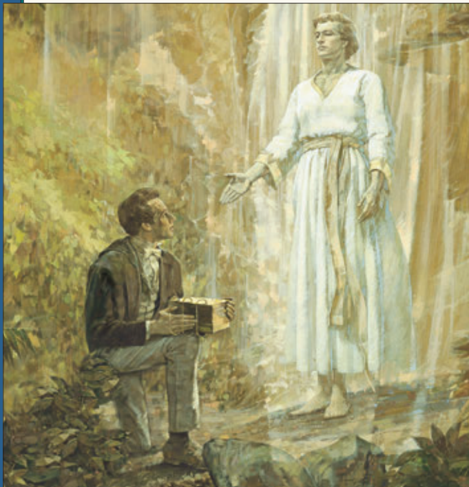
Moroni kembali setahun sekali selama empat tahun dan memberi arahan-arahan tambahan kepada nabi muda itu. Selepas empat tahun itu, Joseph menerima lempeng-lempeng itu dan mula menterjemahkan Kitab Mormon.

Setelah kunjungan ketiga ini, dia naik lagi ke syurga seperti sebelumnya, dan aku ditinggalkan kembali untuk memikirkan keanehan hal yang baru saja aku alami; ketika hampir serta-merta sete-