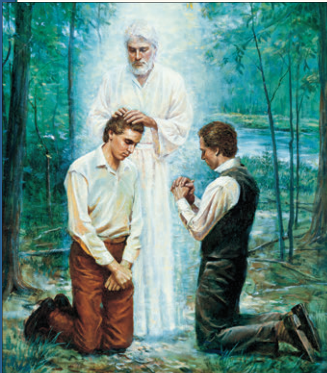
Joseph Smith dan Oliver Cowdery menerima Imamat Harun melalui upacara meletakkan tangan daripada Yohanes Pembaptis pada 15hb Mei 1829.

Dalam bulan April 1829, Joseph Smith, bersama Oliver Cowdery sebagai pencatat, mula menterjemahkan Kitab Mormon dengan kurnia dan kuasa daripada Tuhan. Setelah Joseph menyiapkannya, orang lain berpeluang untuk melihat lempeng-lempeng emas itu. Saksi-saksi ini juga telah mencatatkan kesaksian mereka, kerana “di dalam