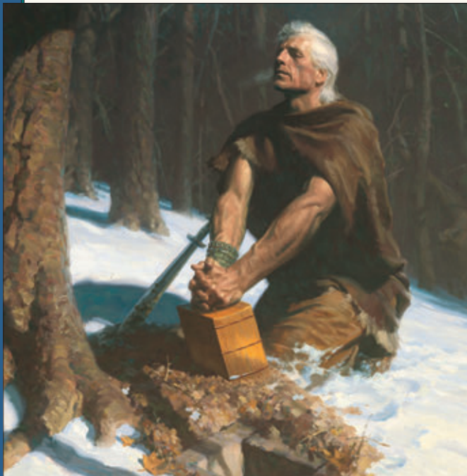
Pada M 421 nabi Moroni menanamkan catatan-catatan suci bangsanya ke dalam Bukit Kumorah. Kemudian, apabila dia kembali sebagai insan yang telah dibangkitkan, dia memberitahu Joseph Smith berkenaan catatan kuno yang mengandungi kegenapan Injil seperti yang disampaikan oleh Juruselamat (Sang Penyelamat) kepada para penduduk kuno benua Amerika. Catatan itu adalah Kitab Mormon.

Juga, bahawa ada dua biji batu di dalam rangkaian-perak berleengkung—dan batu-batu ini, dilekatkan kepada sebuah perisai dada, kesemuanya bersama-sama dipanggil Urim dan Tumim—disimpan bersama lempeng-lempeng itu; dan bahawa dengan memiliki serta menggunakan batu-batu inilah seseorang dapat menjadi apa yang dipanggil “pelihat-pelihat” pada zaman dahulu, dan bahawa