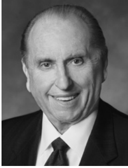
Oleh Presiden Thomas S. Monson