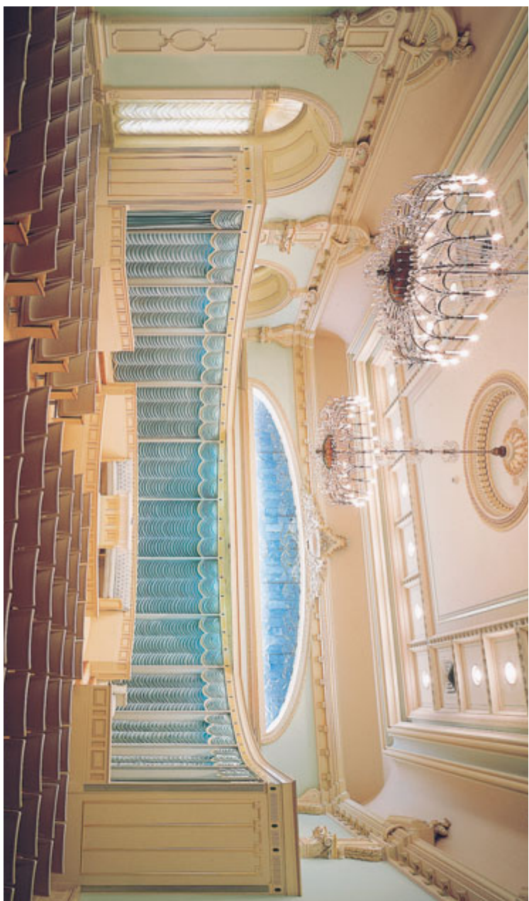
Eftirano terestridiý, Tempolin' i Salt Lake