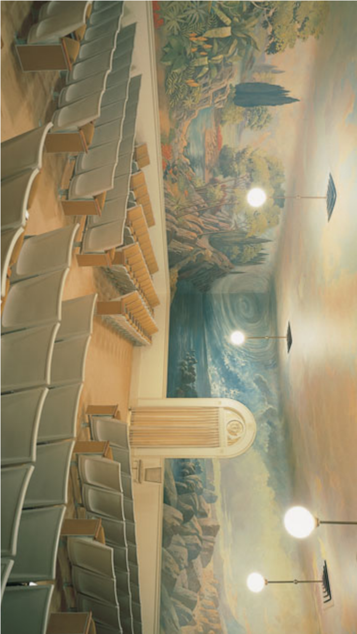
Efitranon'ny fahariana, Tempolin'i Salt Lake