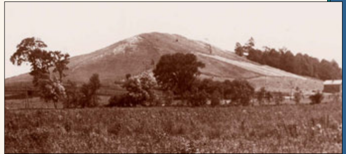
Ny havonan' i Cumorah dia eo amin' ny dimy kilometatra avy ao atsimo atsinanan' ny sahan-dry Smith ao Palmyra, New York. Tamin' ny andron' i Joseph, dia rakotra bozaka ny farany avaratra, ny atsimo kosa feno hazo sy ala miparitaka. Nilevina tao amin' ny ilany atsimo andrefana ireo takelaka, izay tsy lavitra ny tampon-kavoana. Sary: Aogositra 1907.

torimaso, ary dia nandrinandry teo aho, ankon' ny fahagagana noho ny zavatra hitako sy reko. Akory anefa ny hagagako raha nahita io iraka io ihany indray aho teo anilan' ny fandriako sy nandre azy nanantitrantitra na namerimberina indray tamiko ny zavatra tetsy aloha ihany; saingy nampiany fampitandremana ho ahy, ka nilazany tamiko fa hanandrana ny haka fanahy ahy i Satana (noho ny ankohonan-draiko miaina ao anatin' ny fahantrana) hakako ireo takelaka ireo mba hampanan-karena ahy. Nandrara ahy tsy hanao izany izy ka nilaza ny tsy tokony hananako zavatra hafa banjinina rehefa mahazo ireo takelaka ireo aho, afa-tsy ny voninahitr' Andriamanitra sy ny tsy ho voataonan' ny hevitra hafa, afa-tsy ny