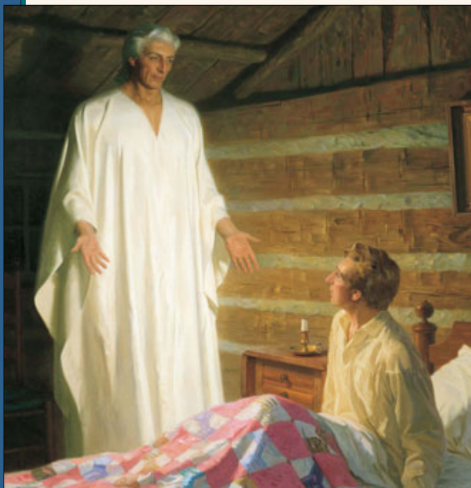
Telo taona taorian' ny Fahitana Voalohany hitan' i Joseph Smith, dia naniraka ny anjely Môrônia Andriamanitra mba hampianatra an' i Joseph mikasika ny famerenana indray ny filazantsaran' i Jesoa Kristy.

Raha mbola nivavaka tamin' Andriamanitra aho dia nahatsikaritra hazavana nipoitra tao