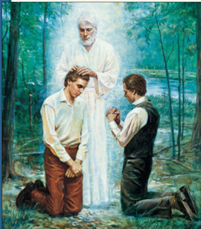
Nahazo ny fisoronan' i Aharôna tamin' ny alalan' ny fametrahan-tanana avy amin' i Jaona mpanao batisa, i Joseph Smith sy i Oliver Cowdery ny 15 Mey 1829.

D ia mbola nanohy ny asa fandikan-teny izahay ary nandeha tany an' ala indray andro ny volana manaraka an' io [Mey 1829] mba hivavaka sy hanontany ny Tompo mikasika ny batisa ny famelan-keloka izay hitanay voalaza tamin' ny fandikana ireo takelaka. Raha mbola sondriana nivavaka sy niantso ny anaran' ny Tompo izahay, dia nisy iraka avy any an-danitra nidina tao anaty