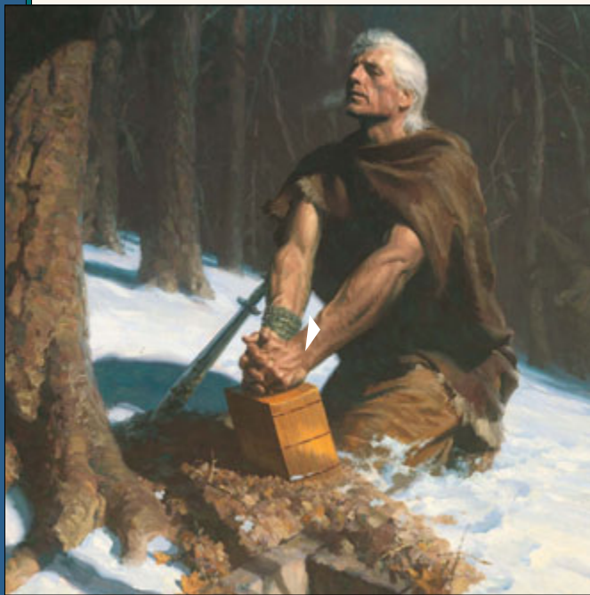
Tamin' ny taona 421 taorian' i J.K, dia nandevina rakitsoratra masina momba ny olony tao amin' ny Havoanan' i Cumorah ny mpaminany Môrônia. Rehefa niverina olona efa nitsangana tamin' ny maty izy tatỳ aoriana dia nilaza tamin' i Joseph Smith momba ilay rakitsoratra taloha izay mirakitra ny fahafenoan' ny filazantsara izay nomen' ny Mpamonjy ireo mponina taloha tao amin' ny Kaontinanta Amerikana. Io rakitsoratra io: dia ny Bokin' i Môrmôna.

“Fa indro, avy ny andro izay mandoro toy ny fatana fandroana, ary ny mpihareha rehetra, eny, ny mpanao ratsy rehetra dia hodorana tahaka