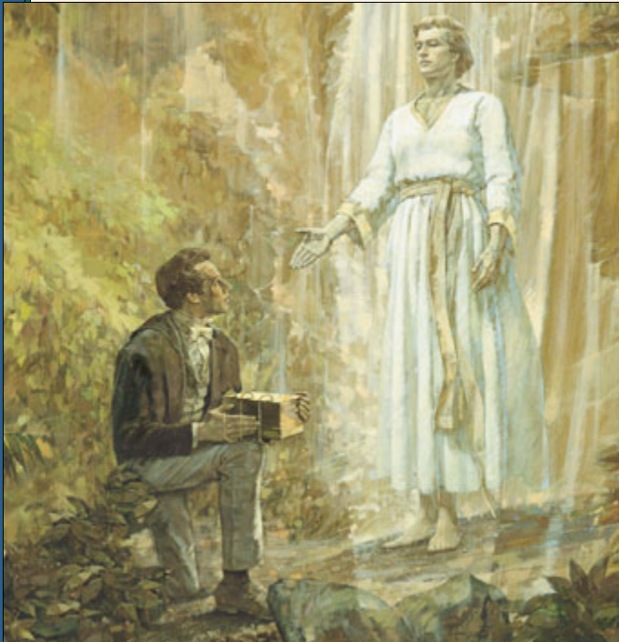
Niverina isan-taona nandritra ny efa-taona i Môrônia ary nampianatra bebe kokoa hatrany ity tanora mpaminany. Taorian' ireo taona efa ireo, dia nahazo ireo takelaka i Joseph ary nanomboka nandika ny Bokin' i Môrmôna.

nanandrana niasa toy ny isan' andro aho dia nahita fa kely ny heriko, hany ka tsy nahefa na inona na inona aho. Tsikaritry ny raiko izay niara-niasa tamiko fa tsy dia tsaratsara loatra aho ka nasainy nody. Dia niainga aho, ary ny fikasako dia ny hody any an-trano;