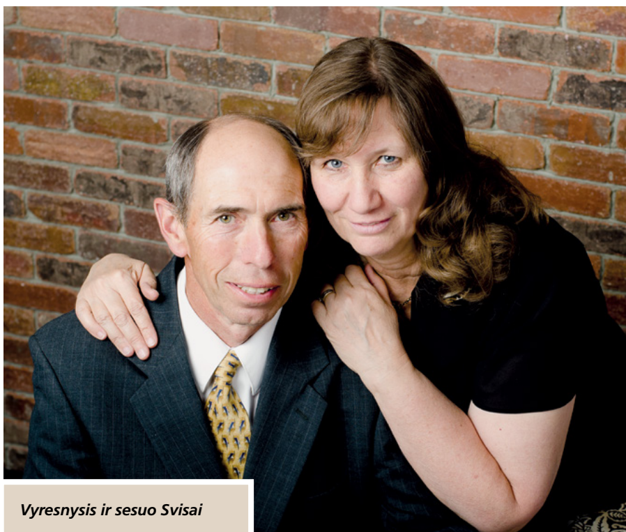
Vyresnysis ir sesuo Svisai

Paklaustas, iš kur semiasi ryžto antrą kartą palikti namus, artimuosius ir tarnauti nepažįstamiems žmonėms,