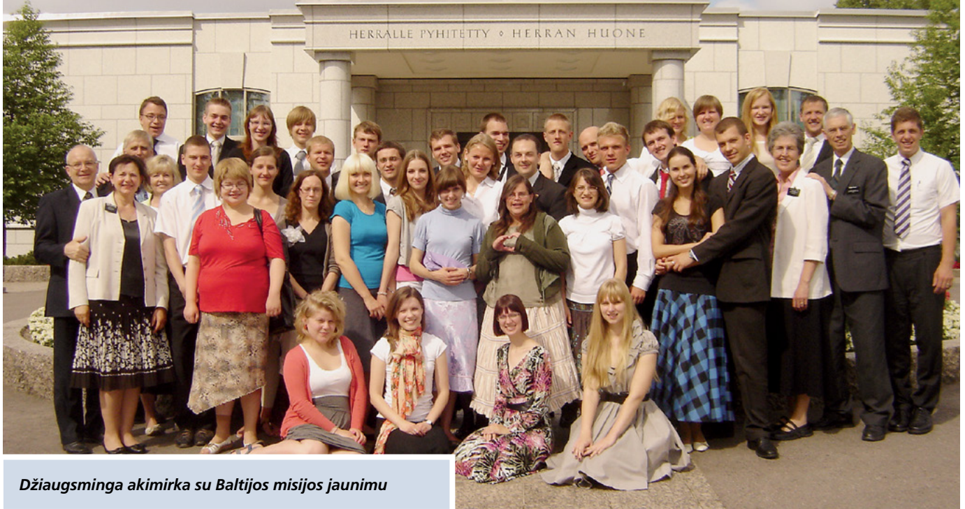
Džiaugsminga akimirka su Baltijos misijos jaunimu